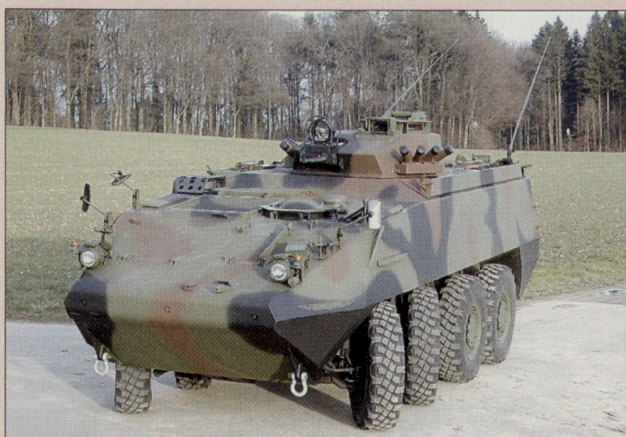
Piranha IIIH 8x8.

Ist übrigens das System von relativ weit auseinander liegenden Blöcken richtig und nicht eine rollende Planung/Anpassungen an sich laufend verändernde latente Bedrohungslagen vorzuziehen? Damit würden auch endlose Diskus-