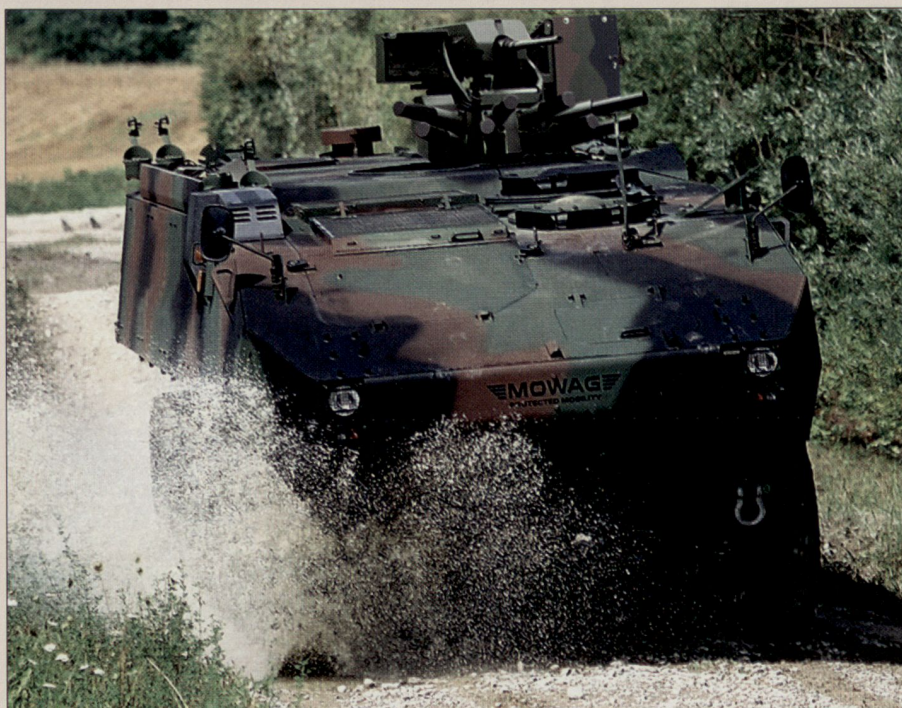
Piranha IIIC 8x8 Radschützenpanzer der belgischen Armee.

Der Piranha III wurde 1997 offiziell vorgestellt und in den vergangenen Jahren aufgrund der stetig gestiegenen Kundenanforderungen laufend weiterentwickelt. Angesichts der zunehmend asymmetrischen Bedrohungsszenarien erstaunt es nicht, dass die Hauptforderungen der Kunden den Schutz gegen Minen und ballistische Waffen betreffen. Aktuell werden denn auch die Schutzsysteme im Hinblick auf improvisierte Explosionskörper und so genannte «Roadside Bombs» optimiert. Hier profitiert das Traditionsunternehmen von den langjährigen Erfahrungen im Bereich Minenschutz. Der Piranha III 8x8 bietet Schutz gegen die meisten proliferierten Minentypen der Welt. Im Gegensatz zu anderen Anbietern verlassen wir uns bei der Überprüfung des Minenschutzes nicht ausschliesslich auf Computersimulationen, sondern haben den Minenschutz mit über 100 Echtversuchen am System erprobt.