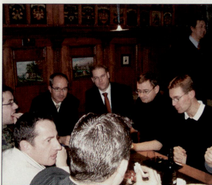
Neumitgliederanlass OG Aarau, Januar 06.

Dieser höchst erfreuliche Umstand gewinnt unter Berücksichtigung des verkleinerten Armee- und somit auch Offiziersbestandes sowie der generell sinkenden