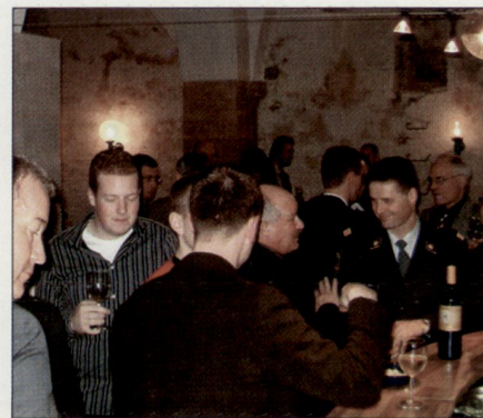
Angeregte Diskussionen an der Generalversammlung der OG Aarau, Februar 2006.

Die Offiziersgesellschaft Aarau (OGA) – mit knapp 500 Mitgliedern die grösste Sektion der Aargauischen Offiziersgesellschaft (AOG) – hat ein in allen Belangen höchst erfolgreiches Vereinsjahr hinter sich. Es braucht aber weiterhin besondere Anstrengungen –, und zwar nicht nur seitens der Offiziersgesellschaften selbst –, damit die Mitgliederbestände stabilisiert und die Sektionen aufrechterhalten werden können.