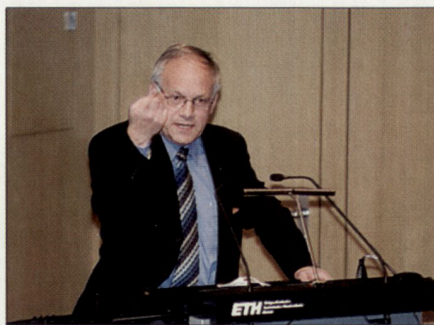
NR Johann Schneider-Ammann: «Freiräume wirken motivierend.»

Nationalrat Johann Schneider-Ammann beleuchtete das Thema aus der Perspektive des Unternehmers. Anhand konkreter Beispiele aus seinem eigenen Unternehmen hob er die Bedeutung der Selbstmotivation, von erreichbaren Zielen sowie des zur Umsetzung notwendigen Freiraums hervor. Aus