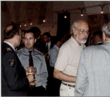
Nach der Podiumsdiskussion der OG Aarau zum Entwicklungsschritt 2008/2011, Juni 2005.

georteten Handlungsbedarf über die kantonale Gesellschaft an die Schweizerische Offiziersgesellschaft zu kommunizieren und Anliegen einzubringen.