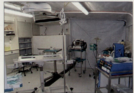
Installierter Sanitäts-Container (inkl. Generator, Wasseranschlüssen und Klimaanlage).

24 Stunden installiert und nach Instruktion des dortigen medizinischen Personals in Betrieb genommen werden. Weitere 30 Container sind zur Weiterverwendung für die humanitäre Hilfe freigegeben worden. Die bisherigen Erfahrungen haben es gezeigt, dass insbesondere in Afrika und in Osteuropa eine grosse Nachfrage nach Hilfsgütern aus Armeebeständen besteht. Mit dem Projekt WAM soll weiterhin massgeblich zur Verbesserung in den Bereichen Gesundheit, soziale Infrastrukturen sowie der lokalen Bereitschaft im Hinblick auf Katastrophen beigetragen werden.