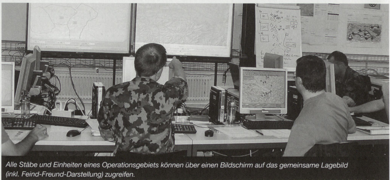
Alle Stäbe und Einheiten eines Operationsgebiets können über einen Bildschirm auf das gemeinsame Lagebild (inkl. Feind-Freund-Darstellung) zugreifen.

Die von der Schweizer Armee zu beschaffenden Komponenten der vernetzten Operationsführung würden teilweise aus dem Ausland, das über entsprechende Kompetenz und Einsatzerfahrung verfügt (z.B. USA, Israel, Spanien, Frankreich), stammen. Die Systemintegration in die Schweizer Armee hätte aber aus Sicherheitsgründen vollständig durch die armasuisse und Schweizer Kompetenzzentren zu erfolgen. Die physische Unabhängigkeit des Netzwerks verunmöglicht unerwünschte Zugriffe auf das Netz oder Komponenten durch Dritte, auch aus dem Umfeld ursprünglicher Hersteller.