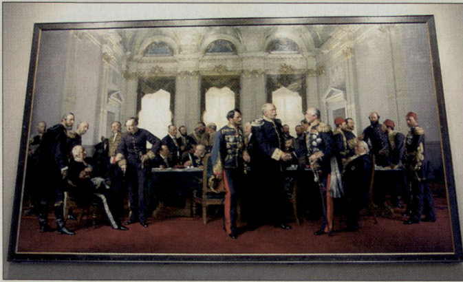
Der Berliner Kongress von 1878.