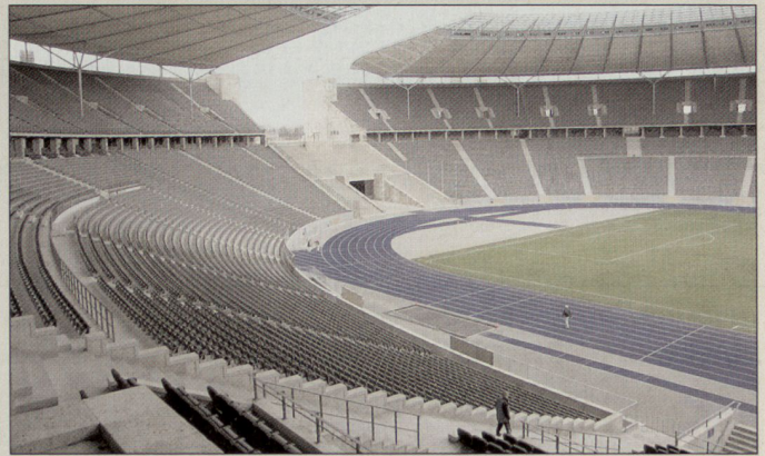
Sicherheit im und um das Olympiastadion.