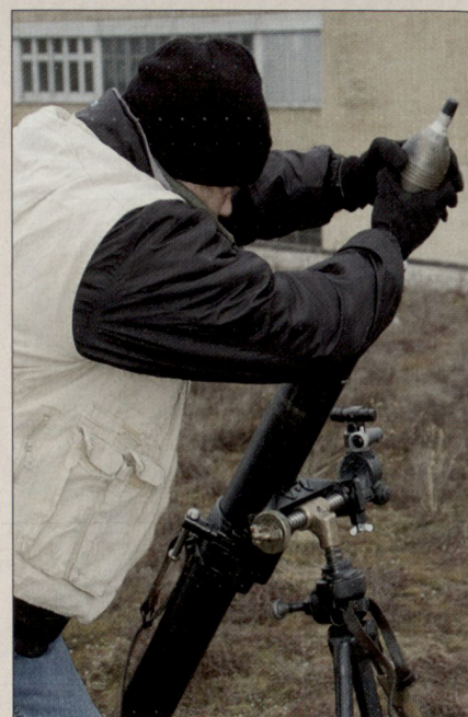
Abschuss von Mörsern durch Aufständische.

Die Aufgabe der DAMA Arbeitsgruppe ist das Feststellen von Fähigkeitslücken und das Finden von möglichen Lösungen, um diese zu schliessen. Die Arbeitsgruppe wird nach einer Schlussvorführung der gefundenen Lösungen im Frühjahr 2007 aufgelöst.