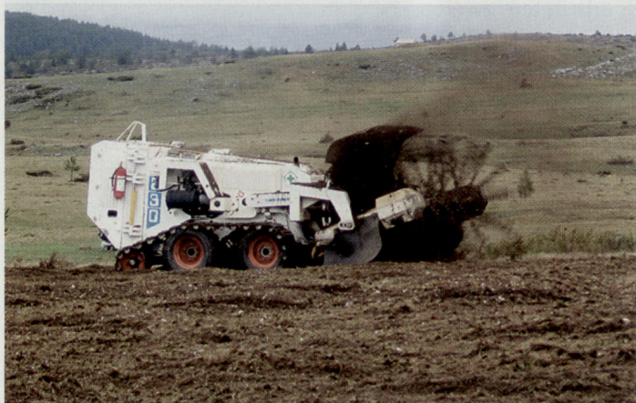
Wo immer es die Topografie zulässt, werden mechanische Minenräummittel eingesetzt.

Die Schweiz (EDA, VBS) unterstützt als Gründungsmitglied das Internationale Genfer Zentrum für humanitäre Minenräumung (GICHD) mit jährlich rund CHF 8 Mio. Nebst der Erarbeitung internationaler Standards stellt das so genannte «Information Management System for Mine Action» (IMSMA) eines der Schwerpunkte des Zentrums dar. Dieses – den Minenräumprogrammen gratis zur Verfügung gestellte – computerunterstützte System verbindet eine Datenbank (Angaben über Minenfelder, Opfer, Räumaktivitäten usw.) mit einem geografischen Informationssystem (GIS). Die analytische Auswertung von Daten hilft den Entscheidungsträgern, Prioritäten für die geplanten Arbeiten zu setzen. Nicht jede Mine soll geräumt werden, sondern in erster Linie diejenigen, welche aus sozial-ökonomischer Betrachtung den grössten Einfluss auf die Bevölkerung haben (Landwirtschaftsland, Wasser, Strassen, Schulen usw.). IMSMA wird inzwischen in über 40 internationalen Minenräumprogrammen verwendet und gilt heute als Standardsoftware. IMSMA wird zudem heute auch von der UNO in friedenserhaltenden Operationen eingesetzt. ■