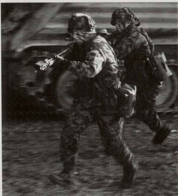
Der mechanisierte Grenadier – Soldat der Zukunft für den Kampf im überbauten Gebiet

nicht der gleiche VBS-Berater nach einem Besuch auf dem Balkan das hohe Lied der streng ausgelesenen dänischen Blauhelme gesungen, die ihm durchwegs einen professionellen Eindruck hinterliessen, mit Stolz einen Dienst leisteten, den sie als ein Privileg betrachteten? Nach dem Versagen der Uno-Truppen beim Massenmord von Srebrenica sind wir alle klüger, oder doch nicht alle? Kurt Tucholsky schrieb 1930 die Satire «Der Reisebericht». Besser kann man solche Kurzbesuche nicht darstellen.