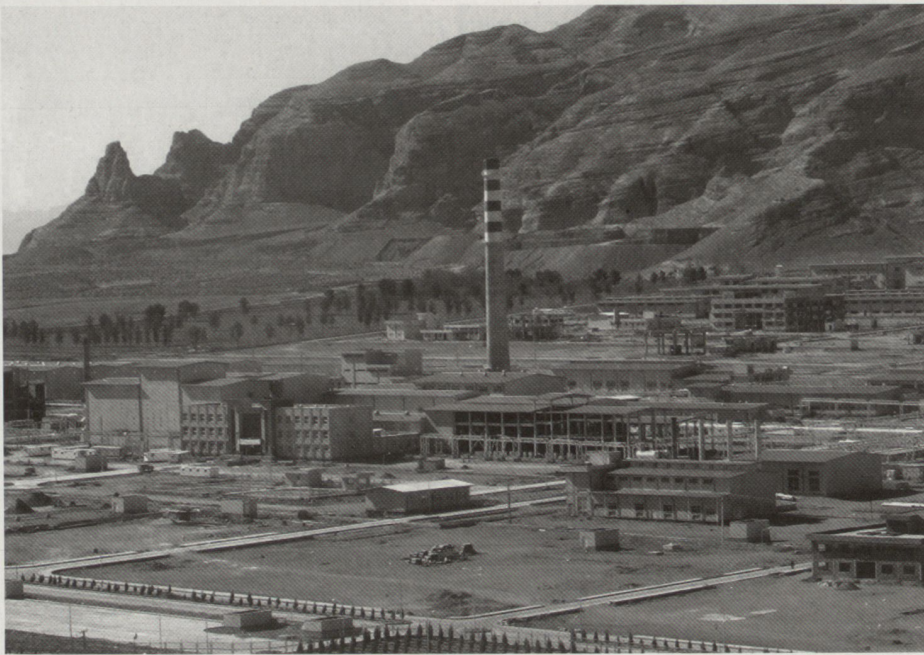
Die iranische Uran-Anreicherungsanlage in Isfahan

Ukraine bewerkstelligen (Die US-Regierung hat eine Amtsstelle gegründet mit diesem Auftrag). Oder: Ein atomar bewaffneter Iran werde sich nach einer ersten Konfrontation mit Israel zu einem de facto-Kriegsverhinderungskartell vereinen wie einst die USA und die Sowjetunion nach der Kuba-Krise. Mehrere europäische Grossbanken haben ihre Geschäftstätigkeit mit iranischen Kunden eingestellt. Die USA haben Israel 500 bunkerbrechende Bomben geliefert.