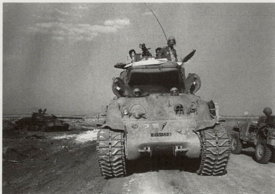
1973, Yom Kippur-Krieg: «Klassischer Panzer-Vormarsch»

Was ist denn nun der Nutzen militärischer Gewalt? Im Gutmenschen-Vokabular von gestern handelt die Antwort von «Sicherheit pro-