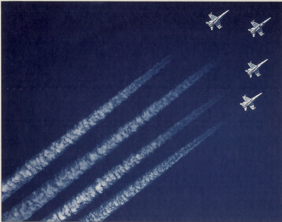
Vier F/A-18 mit Kondensstreifen bilden das BfK-Logo.