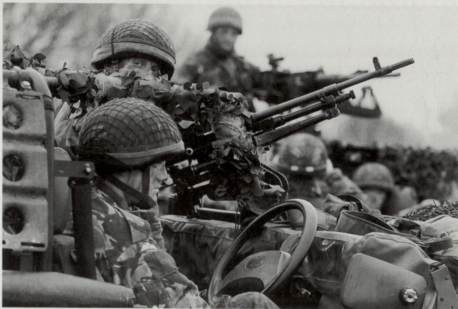
Paratroopers auf Land Rover WMIK ( weapons mounted installation kit ). Das WMIK, bestehend aus dem schweren MG Browning (12,7 mm) sowie einem 7,62-mm-MG. Das Fahrzeug als solches ist luftverlastbar, hoch mobil und damit ideal für Luftlandetruppen.