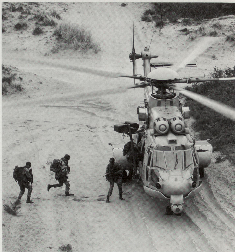
Der EC 725 Cougar wurde speziell für CSAR ( Combat Search and Rescue ) und Sonderoperationen entwickelt.

Ein weiterer Ansatz, um die Fähigkeitslücken im Bereich des strategischen Lufttransports zu überbrücken, ist das zeitliche Staffeln des Verlegens einer Kampfgruppe unter Einbezug von Seetransport. Das EU-Battle-Group-Konzept verlangt zwar, dass eine Kampfgruppe zehn Tage nach Entscheidung der EU in der Lage ist, eine Mission durchzuführen. Dies muss aber nicht unbedingt bedeuten, dass bereits der gesamte Verband vor Ort eingetroffen ist. Operation Palliser ist diesbezüglich geradezu beispielhaft.