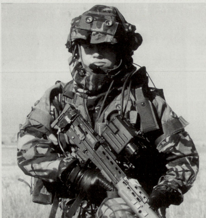
Die diversen Entwicklungsprogramme für den «Infanteristen der Zukunft» sollen auf europäischer Ebene koordiniert werden. Im Bild: Projekt «Future Infantry Soldier Technology» bei der britischen Armee.

Um die Wirksamkeit bei Einsätzen unterhalb der Kriegsschwelle zu verbessern, werden auf europäischer Ebene seit einiger Zeit in einer multinationalen Arbeitsgruppe die Verwendung sowie die möglichen Einsatzverfahren von nichttödlichen (nicht-letalen) Waffen studiert. Der Einsatz solcher «schonender» Wirkmittel soll gemäss Studien neue Möglichkeiten der Konfliktbeherrschung schaffen, dies insbesondere auch im Rahmen laufender Operationen zur Krisenbewältigung und bei der Eindämmung aufkommender neuer Konflikte. Wie die Erfahrungen zei-