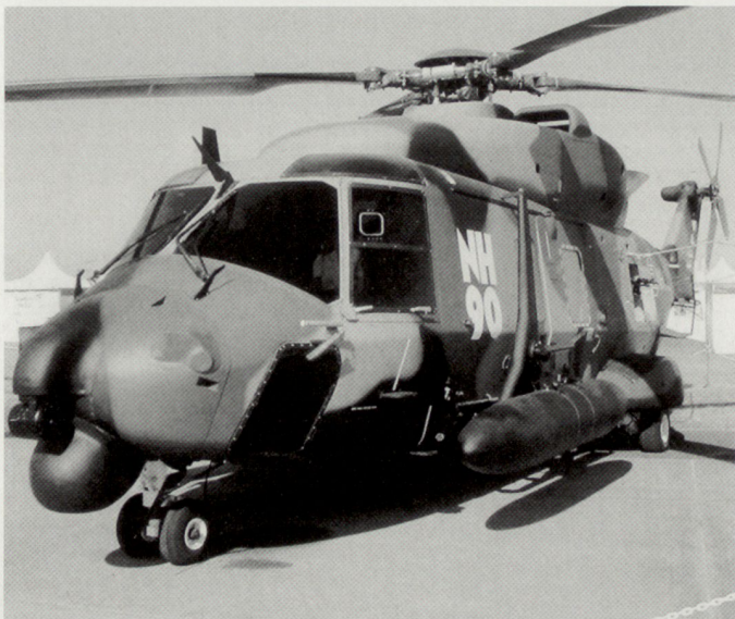
Ein Beispiel europäischer Rüstungszusammenarbeit ist der neue Transporthelikopter NH-90, der bisher von neun europäischen Armeen bestellt worden ist.

Die Realisierung der geplanten, äusserst aufwendigen Ausrüstungsplanung ist für die europäischen Streitkräfte nur mit einer verbesserten europäischen Rüstungsindustrie möglich. Zudem besteht eine verstärkte Forderung nach rüstungstechnischer Zusammenarbeit und gleichzeitiger Harmonisierung des militärischen Bedarfes. Weil auch die US-Streitkräfte mit den gleichen Problemen zu kämpfen haben, wird auch weiterhin in wesentlichen Technologiebereichen eine transatlantische Zusammenarbeit notwendig sein. Dennoch wird es für Europa – trotz einer Intensivierung der gemeinsamen Entwicklungsanstrengungen – kaum möglich sein, in den wesentlichen, militärisch relevanten Technologiebereichen mit den USA einigermassen Schritt zu halten. ●