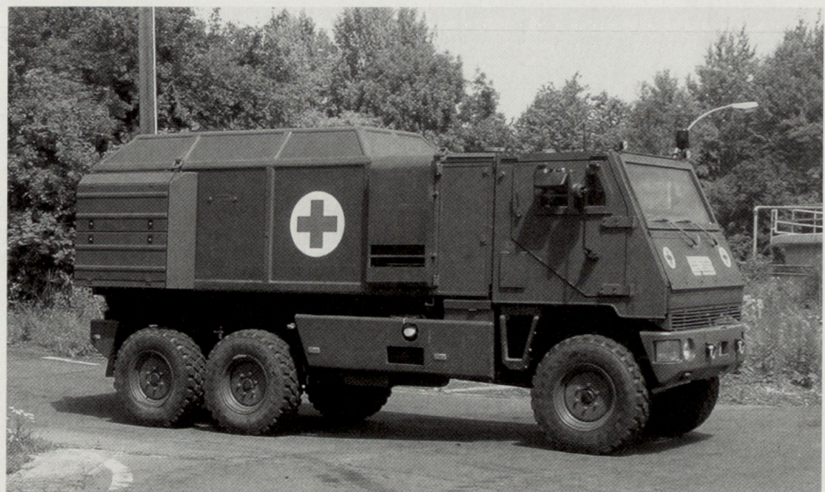
Das von Mowag hergestellte Mehrzweckfahrzeug «Duro 3» erfüllt die gestiegenen Anforderungen künftiger Streitkräfte an einen geschützten Transport in optimaler Weise.

Auch einzelne Soldaten sollen künftig befähigt sein, sich lageabhängig gegen alle Formen einer von regulären und irregulären Kräften ausgehenden Bedrohung zu schützen. Die diversen laufenden, nationalen Entwicklungsprogramme im Bereich «Infanterie der Zukunft» zeigen die künftige hohe Bedeutung dieser Truppen auf. Elemente der neuen Ausrüstung sind u. a. modulare Schutzweste, moderne Funkausrüstung mit Anbindung an die taktische Führung, digitale Kartenausrüstung, GPS, moderne Nachtbeobachtungsmittel und integrierter ABC-Schutz. Nebst der materiellen Ausstattung zur Verbesserung der Durchsetzungsfähigkeit in den unterschiedlichen Einsatzoptionen soll ein bestmöglicher Schutz erreicht werden. Unterdessen ist auf europäischer Ebene bezüglich «Infanterie der Zukunft» eine Entwicklungszusammenarbeit eingeleitet worden, um die Einzelprojekte frühzeitig koordinieren zu können.