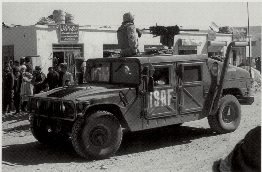
Auch kleine europäische Armeen bauen Mittel und Fähigkeiten auf, um an multinationalen Stabilisierungsoperationen teilzunehmen. Im Bild: litauische Patrouille bei der ISAF in Afghanistan.

Die bisher geplanten und teilweise realisierten nationalen Führungs- und Informationssysteme der Teilstreitkräfte müssen in den nächsten Jahren mit viel Aufwand in teilstreitkräfteübergreifende Gesamtsysteme überführt werden. Für die Interoperabilität mit Alliierten sind auf europäischer Ebene sogenannte «Multinational Integration Programs» definiert worden. Damit die Interoperabilität bei den laufenden multinationalen Einsätzen gewährleistet werden kann, wird vorerst mit Priorität eine Beschaffung und Koordination bei den taktischen Führungssystemen angestrebt. Beispielsweise das deutsche System Führungsausstattung Taktisch (FAUST), das auch bei anderen europäischen Armeen eingeführt werden soll. Ziel ist es dabei, jedes Einsatzfahrzeug und später auch mindestens jede moderne Infanteriegruppe über eine netzwerkorientierte IT-Ausstattung in ein multinationales Gesamtführungssystem zu integrieren.