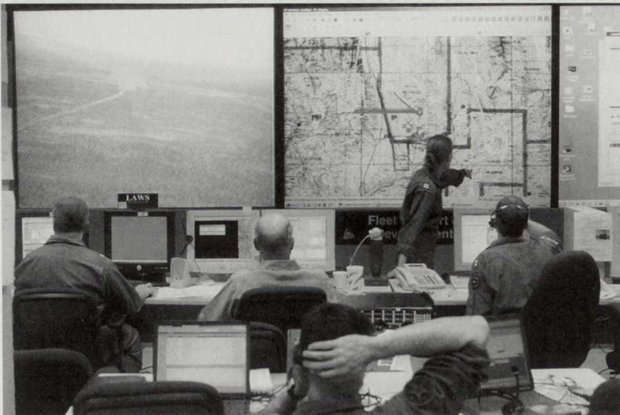
Die Verbesserung der Führungsfähigkeit hat oberste Priorität; damit soll die netzwerk-basierte Operationsführung in streitkräftegemeinsamer und multinationaler Einbindung sichergestellt werden.