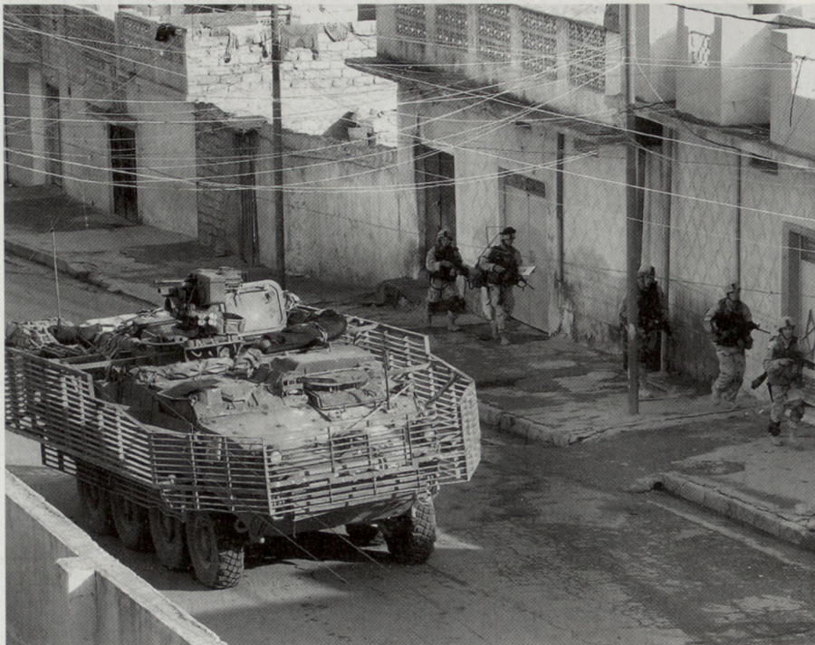
Die Einsatzerfahrungen im Irak haben die Bedeutung von «Force Protection» deutlich aufgezeigt, wobei vor allem Schutzverbesserungen bei den Schützenpanzern und Transportfahrzeugen notwendig sind. Im Bild: Schützenpanzer «Stryker» der US Army.

Die Durchhaltefähigkeit wird heute wesentlich auch durch sichere und einsatzerhaltende Unterbringung von Soldaten und Material bestimmt. Mittel für eine zweckmässige und zeitgerechte, an die Umweltbedingungen angepasste Unterbringung (Wohncontainer und moderne Truppencamps) sind unerlässlich.