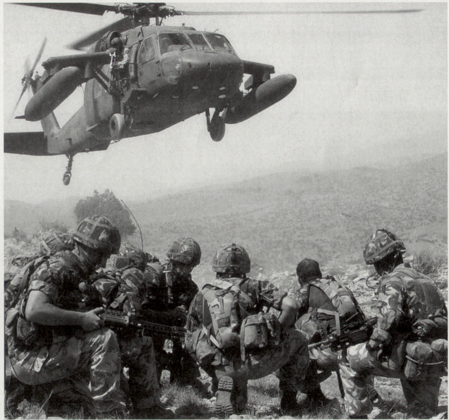
Mit der Zunahme von Truppeneinsätzen in Krisenregionen und dem weltweiten Kampf gegen den internationalen Terrorismus hat der Bedarf an Spezialtruppen laufend zugenommen. Im Bild: britische Royal Marines im Süden Afghanistans.

Wie die Einsatzerfahrungen aus den militärischen Operationen der letzten Zeit aufzeigen, kann die bisher übliche Überlegenheit westlicher konventioneller Rüstungstechnologien bei Einsätzen gegen die neuen asymmetrischen Bedrohungen nur noch in beschränktem Masse genutzt werden. Bei laufenden militärischen Operationen in Konfliktregionen (beispielsweise in Afghanistan und Irak) handelt es sich um Gewaltkonflikte niederer bis mittlerer Intensität, die vor allem mittels Kleinwaffen und improvisierten Sprengmitteln ausgeführt werden. Dieses komplexe, zivilmilitärische Umfeld stellt moderne Streitkräfte – trotz optimaler Ausrüstung und Bewaffnung und grosser Informationsüberlegenheit – vor immer grössere Probleme. Entsprechende Anpassungen, auch im technologischen und materiellen Bereich, sind deshalb unerlässlich. Aus den Erfahrungen militärischer Operationen der letzten Jahre sind bereits erste Lehren und Konsequenzen gezogen worden (beispiels-