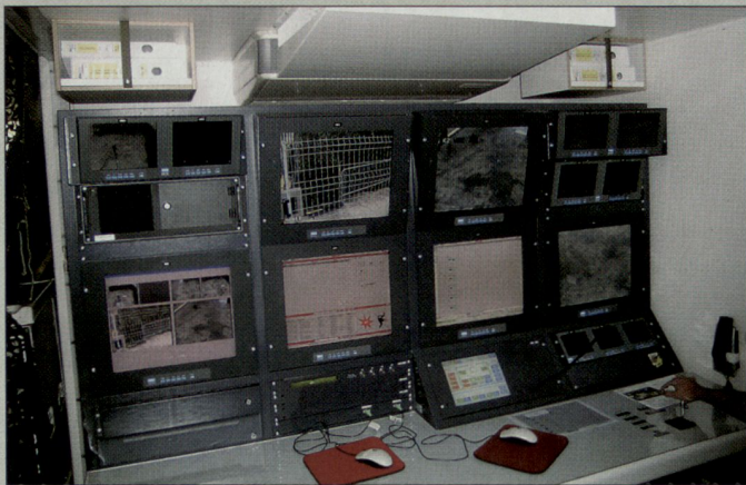
Arbeitsplatz des Überwachungssystems 98.

lose Zusammenarbeit ein, von der Planung über das Einholen der Behördenentscheide bis zur Durchführung. Nichts hat in den letzten Jahrzehnten die Sicherheitskooperation so vorangebracht wie das WEF und die sporadisch in unserem Land – oder wie der G8-Gipfel hart an der Landesgrenze – veranstalteten internationalen Konferenzen. Das System unserer inneren Sicherheit gleicht einem in seinem Chitinpanzer gefangenen Krebs, der immer wieder nur eine kurze Weile lang wachsen kann, wenn er sich gerade gehäutet hat. Die beschriebenen Grossanlässe decken gnadenlos Mängel auf und erzwingen rasch einen Entwicklungsschub. Die Öffentlichkeit nimmt das kaum wahr; der verbreitete Eindruck des Stillstandes täuscht mitunter, zum Glück.