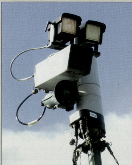
Er sieht bei Tag und Nacht weiter und besser – Mast mit Sensoren des Überwachungssystems 98.

könnte an der sichtbaren Armeepresenz Anstoss nehmen oder sich gar ängstigen. Tatsächlich schätzt eine Mehrheit selbst der betroffenen und mitunter gestörten Anwohner den militärischen Botschaftsschutz –, von überwiegender Ablehnung keine Spur, wie eine wissenschaftliche Erhebung zeigt. 3 Höchstens bedingt scheint die Bevölkerung die rechtlich und politisch durchaus begründbare Skepsis ihrer Behörden zu teilen, wie sie nach wie vor dem militärischen Botschaftsschutz gilt.