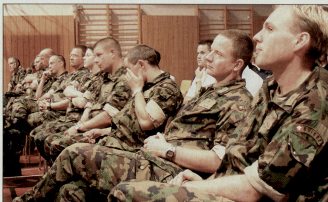
Berufskader der Log OS.