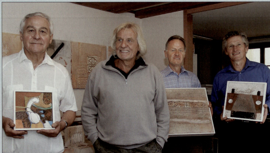
Besuch der ASMZ-Delegation im Atelier in Teuffenthal, 15. September 2006.

Jedes Jahr werden einige Bauten dieser 35 Schulen repariert und saniert. Das Mobiliar für die Klassenzimmer wird vor Ort durch stiftungseigene Störenscreiner angefertigt. Leider reichen die Mittel der Stiftung nicht aus, all das instandzustellen, was unbedingt notwendig wäre. Wir hoffen deshalb, für einzelne Sanierungsprojekte Sponsoren zu finden.