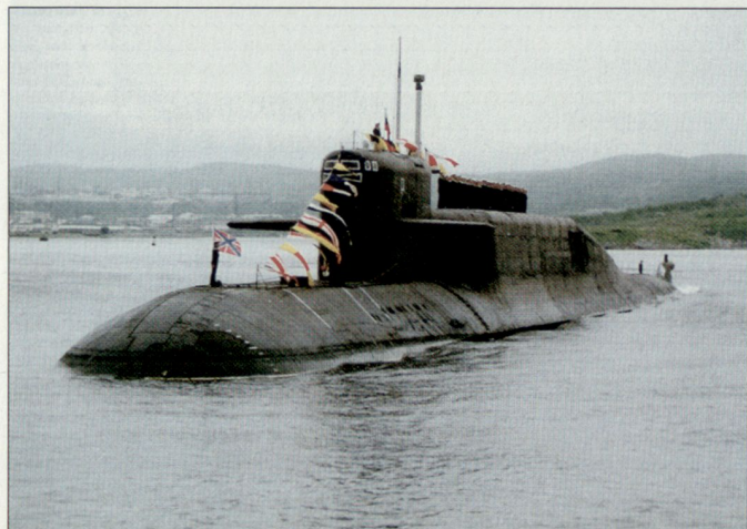
Russisches U-Boot der «Delta-Klasse», ausgerüstet mit 16 Interkontinental-Lenk Waffen.

grosser Bedeutung. In den letzten Jahren wurde allerdings die russische Marine stark vernachlässigt, wobei ein teilweiser Zerfall der strategischen U-Boot-Flotte und auch anderer Teile der Marine-streitkräfte eingetreten ist.