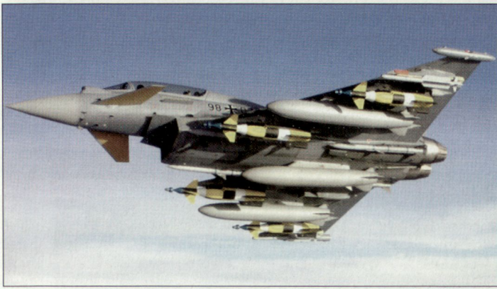
Bisher sind vom «Eurofighter»-Programm insgesamt 638 Maschinen bestellt worden.

und sie am Flachbildschirm lesen. Wenn alle Geschwader, die den «Eurofighter» erhalten, mit dem neuen Flugsimulator ausgerüstet sind, können sie sogar vernetzt gegeneinander fliegen und den Luftkampf üben. Dadurch kann viel Geld eingespart werden, denn die wesentlich teurere Ausbildung am Originalgerät, die weiterhin aber unverzichtbar ist, wird auf ein Minimum reduziert. Eine kleine, mittelständige Firma in der Nähe von Starnberg hat den neuen Flugsimulator für den «Eurofighter» entwickelt. Ausser der Pilotenkanzel sind alle Instrumente, Schalter