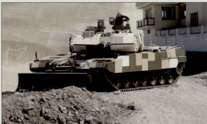
Demonstrator des neuen Kampfpanzers «Leopard 2 PSO».

In letzter Zeit haben sich auch andere Kampffahrzeughersteller, wie beispielsweise die französische Firma Giat, mit der Weiterentwicklung von Panzern beschäftigt. So hat Giat eine neue Version des Kampfpanzers «Leclerc» präsentiert, der mit seiner Zusatzausstattung ebenfalls für Einsätze im urbanen Gebiet vorgesehen ist. hg