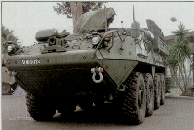
Versuche mit dem aktiven Schutzsystem «Trophy» auf dem Schützenpanzer «Stryker».

Zwischen der US-Firma General Dynamics Land Systems und den Entwicklungsverantwortlichen von Rafael ist unterdessen ein Abkommen geschlossen worden, um «Trophy» auch in den USA zum Einbau in Landfahrzeuge anbieten und vermarkten zu können. hg