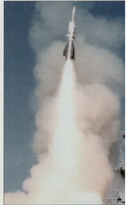
Die bisherigen Testversuche mit der Flugkörperabwehr rakete «Aster» waren mehrheitlich erfolgreich.

Die durch die Firmengruppe MBDA für die Marinen der drei beteiligten Staaten entwickelte Abwehr rakete ist als Schutz von Marineeinheiten gegen Beschuss durch taktisch-operative Lenk waffen gedacht. Die maximale Einsatzdistanz soll rund 120 km und die maximale Einsatzhöhe gegen 30 km betragen. Das Gesamtgewicht der rund fünf Meter langen Abfang rakete beträgt 510 kg. Das Abwehrsystem «Aster 30» soll künftig eine wesentliche Komponente bei der von EUROSAM für die in Einführung stehenden