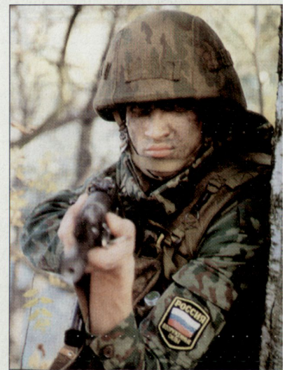
Mit einer neuen Doktrin sollen die russischen Streitkräfte auf die künftigen Bedrohungen ausgerichtet werden.

Die neue Doktrin soll mehr auf die aktuellen Bedrohungen Russlands ausgerichtet sein und diese auch genauer definieren. Zudem wird eine Umschreibung allfälliger Verbündeter und der möglichen wahrscheinlichsten Feinde des russischen Staates vorgenommen. Die Mängel der Militärdoktrin von 1993 und teilweise auch der überarbeiteten Doktrin 2000 hätten zu einer Krise resp. Zerrüttung in der Armee geführt. Zudem hätten diese mangelhaften Grundlagen die Tragödien der beiden Tschetschenien-Kriege teilweise zu verantworten. Als wesentliche Bedrohung werden extremistische und gewalttätige Aktivitäten von religiösen, separatistischen und insbesondere terroristischen Bewegungen und Organisationen, die gegen Russland gerichtet sind, bezeichnet. Im Weiteren wird auch die Unterdrückung resp. die Geiselnahme russischer Bürger in anderen Staaten genannt. Gemäss Aussagen des Verteidigungsministeriums wäre künftig auch die Teilnahme Russlands an gemeinsamen Militäraktionen zusammen mit den USA oder der NATO, sei dies gegen den internationalen Terrorismus oder allenfalls gegen eine akute Bedrohung mit Massenvernichtungswaffen, möglich. Aber die USA und ihre Verbände