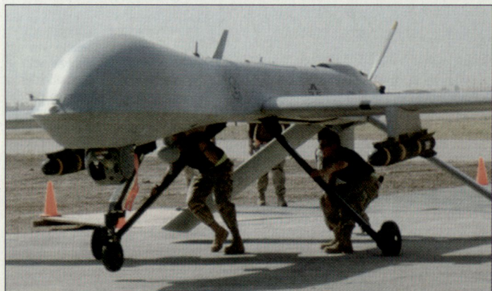
Bewaffnete Version des Drohnensystems «Predator» (Einsatz von Lenk Waffen «Hellfire» bei der US Air Force).

Die durch das italienische Kontingent eingesetzten UAVs hatten in nur einem Jahr mehr als 1000 Flugstunden erreicht. Dabei wurden in der Region Dhi Qar, d. h.