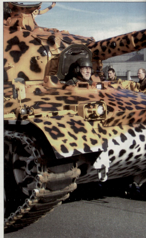
Das Maskottchen des Swiss Tank Challenge, die Leopardine.

Am Samstag, dem 12. November, fand als Abschluss der Wettkämpfe die alljährliche Steel Parade statt, bei der Fahrzeuge, die bei der Motorisierung der Schweizer Armee eine Rolle gespielt haben, gezeigt wurden. Als Höhepunkt und Schweizer Premiere konnten Tausende von Schaulustigen dieses Jahr auch russische Panzerfahrzeuge bewundern. Mit viel Lärm und noch mehr Rauchentwicklung rollten der mittlere Kampfpanzer T 34/85, der Kampfpanzer T 55, der Führungspanzer BTR 50 PU und der Aufklärungspanzer PSH über die Thuner Allmend. Die Fahrzeuge waren im Frühling dieses Jahres aus Ungarn ins Schweizerische Militärmuseum Full/AG gekommen und restauriert worden. Die Vorführung hatte Symbolcharakter: Panzerfahrzeuge, die während des Kalten Krie-