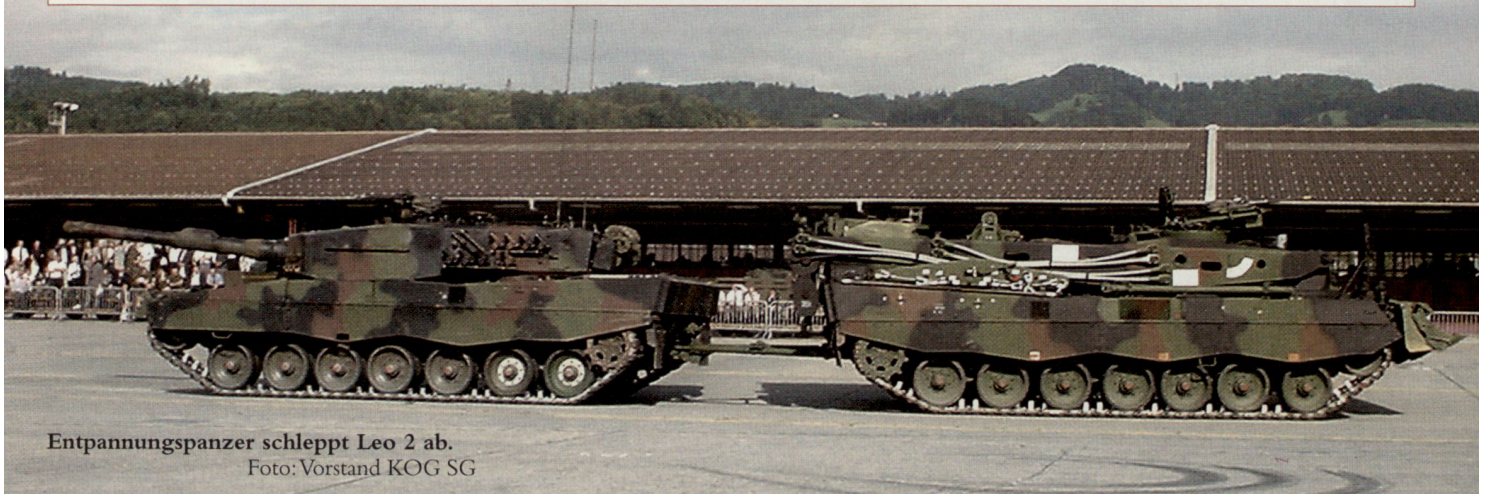
Entpannungspanzer schleppt Leo 2 ab.

Wir wären sehr gerne wieder dabei. Und wenn wir heute siegen, sind wir ja fast verpflichtet, beim nächsten Mal wiederzukommen und unseren Titel zu verteidigen! ■