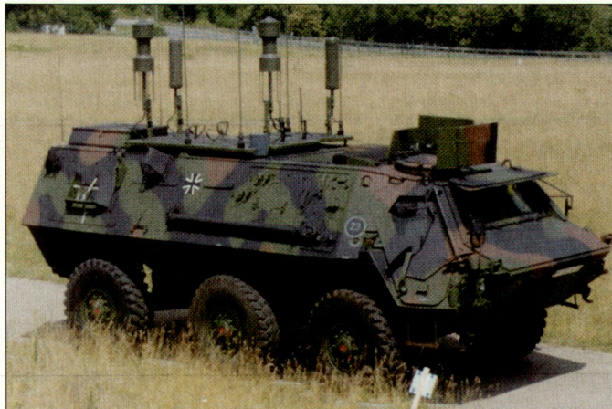
Prototyp eines Störsenders gegen ferngesteuerte Sprengfallen auf einem gepanzerten Transportfahrzeug «Fuchs».

Aktuell werden darüber hinaus auch Störsender realisiert, mit deren Hilfe einzelne Fahrzeuge oder auch Konvois gegen die Wirkung von funkferngesteuerten Sprengfallen geschützt werden. Auf den Frequenzen, die von gegnerischen Kräften für Funkfernsteuerungen genutzt werden können, wird ein entsprechend hoher Störpegel erzeugt, sodass in einem bestimmten Umkreis um diese Störfahrzeuge platzierte Sprengfallen kein Zündsignal empfangen und somit unwirksam werden. Die neuen Störmittel sollen künftig die deutschen Truppen in Krisenregionen vor allem gegen IEDs (Improved Explosive Devices) schützen. hg