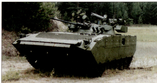
Priorität bei den russischen Landstreitkräften hat weiterhin die Modernisierung vorhandener Waffensysteme (Bild: modernisierter Schützenpanzer BMP-2M).

Wertmässig dürften dabei die Nuklearstreitkräfte zusammen mit den kosmischen Truppen einmal mehr am meisten profitiert haben. Bei den strategischen Raketenruppen wurden weitere silogestützte SS-27 «Topol-M» in Dienst gestellt, sodass unterdessen ein strategisches Raketenregiment vollständig damit ausgerüstet sein soll. Im Herbst 2006 konnte zudem die erste mobile «Topol-M» den Truppen übergeben werden. Die Flugkörper des Raketen systems SS-27 werden von den Rüstungswerken Votkinskij in der Wolgarepublik Udmurtien produziert. Nebst wei-