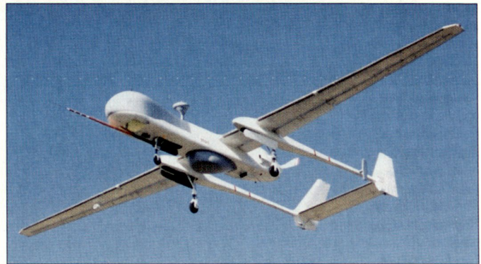
Ergänzend zu den taktischen Drohnensystemen «DRAC» beschaffen die französischen Streitkräfte auch UAVs vom Typ «Eagle-1» (Bild).

samt 160 taktischen UAV-Systemen DRAC (Drone de Reconnaissance Au Contact) vor, die für den Aufklärungsbedarf des französischen Heeres vorgesehen sind. Die Auslieferung soll bereits in diesem Jahr beginnen. Mit dem als «lenkbares Fernglas» funktionierenden unbemannten Luftaufklärungssystem DRAC können Tag und Nacht Bilder in Echtzeit beschafft und laufend verarbeitet