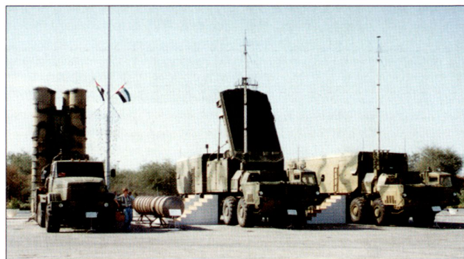
Komponenten des russischen Luftverteidigungssystems S-300 PMU anlässlich einer Rüstungsausstellung.

verteidigungssystem aufzubauen. Im Wesentlichen sollen dabei Systeme vom Typ S-300PS zu Einsatz gelangen. Diese strategisch nutzbaren Luftverteidigungssysteme werden vom russischen Rüstungskonzern Almaz-Antey hergestellt und werden auch seit Jahren unter der Bezeichnung S-300 PMU auf dem internationalen Rüstungsmarkt angeboten. Die Reichweite dieser Flab-Lenk Waffen soll etwa 150 km und die maximale Bekämpfungshöhe von Luftzielen rund 27 km betragen. hg