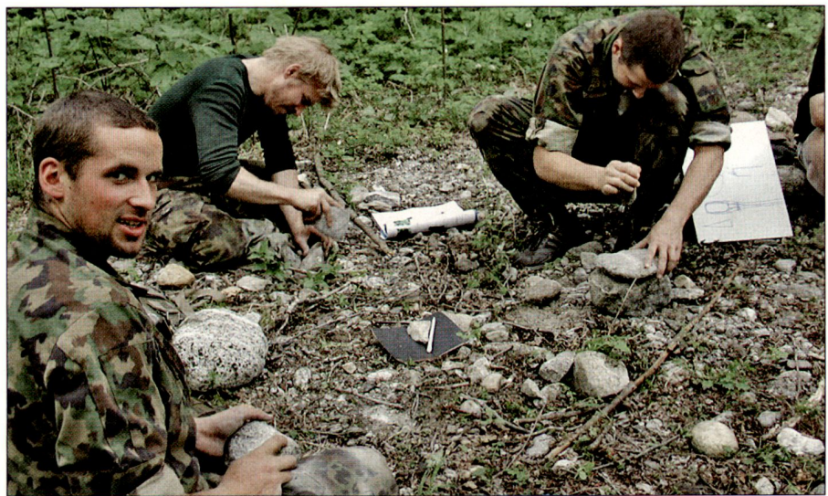
Wichtiges Survival-Handwerk: Steinbearbeitung.

Überlebenskompetenz erfordert Wissen. Es ist erfreulich, dass mit 15% des zeitlichen Aufwandes bereits 85% der notwendigen Wissensinhalte im Bereich Überleben ausgebildet werden können. Die Vermittlung der verbleibenden 15% des Wissens benötigt also mehr als fünf Mal länger. So kann auch in begrenzter Unterrichtszeit eine wirkungsvolle Grundlage für Überlebenskompetenz gelegt werden. Das notwendige Wissen für eine solide Überlebensausbildung ist riesig, und die Auswahl von Ausbildungsinhalten muss sorgfältig und bewusst erfolgen. Zudem reicht es nicht, aus einem Buch über Überlebenstechniken vorzulesen und anzunehmen, Überlebenskompetenz sei dann ausgebildet. Eine umfassende