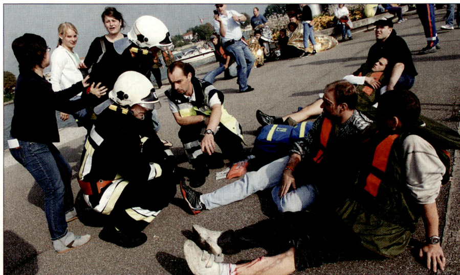
Betreuung von verletzten Passagieren auf französischer Seite.