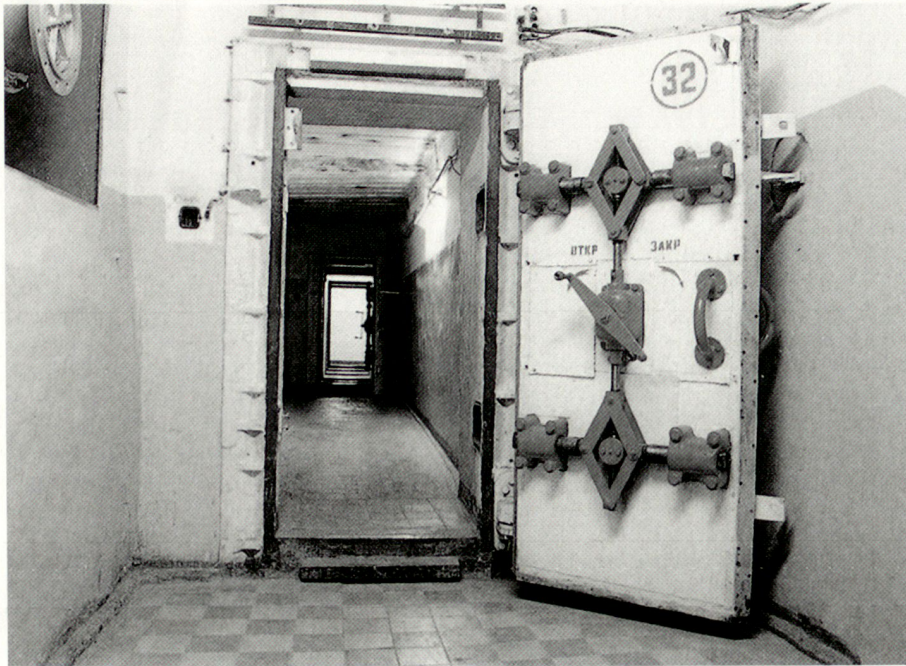
Eingang zum Nachrichtenteil der unterirdischen Kommandozentrale der Gruppe Sowjetischer Truppen in Deutschland in Wünsdorf-Zossen, südlich von Berlin. Diese Anlage diente ursprünglich der deutschen Wehrmacht, wurde dann in den 60er-Jahren durch die Sowjets umgebaut. Heute ist diese Anlage als Teil eines Museums zu besichtigen.