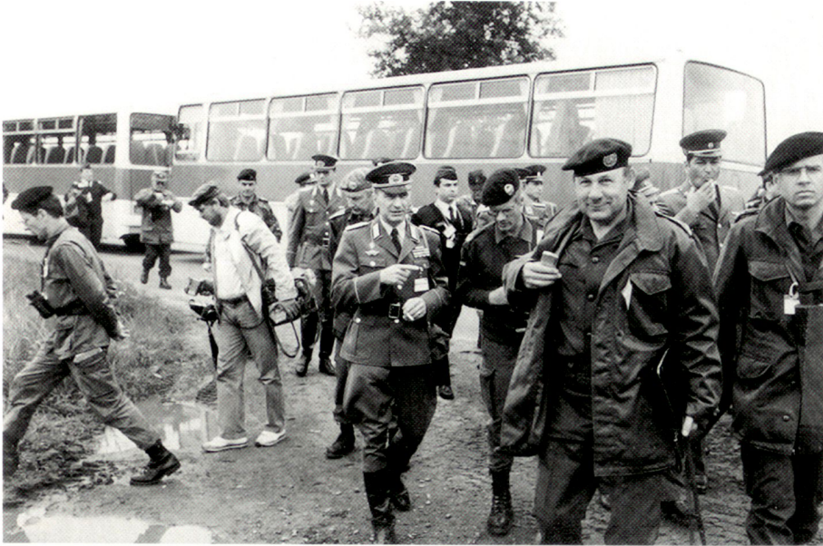
Offiziere der Nationalen Volksarmee (NVA) begleiten westliche Beobachter anlässlich einer grossen Übung in der DDR im Sommer 1987. Für damalige Verhältnisse waren Begegnungen wie diese zwischen dem westdeutschen Manöverbeobachter, Oberst Schuster (vierter von rechts, mit Béret, leicht verdeckt), und dem ostdeutschen Begleiter, Oberst i Gst Herrich (fünfter von rechts, mit Schirmmütze, später Generalmajor), eher noch eine Seltenheit.

Kaum für die Militäraufklärung, aber für die HVA war die Schweiz zudem von Bedeutung für Wirtschafts- und Industriespionage, Beschaffung wissenschaftlicher Forschungsergebnisse und als Beschaffungslinie für Embargowaren aus dem Westen.