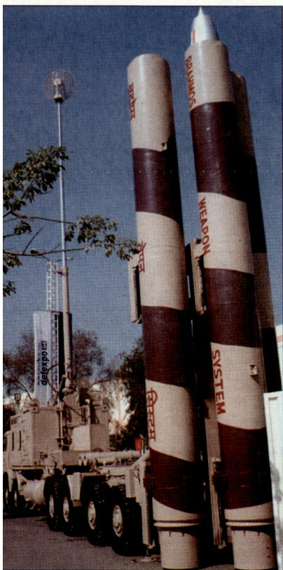
Landgestützte Version des Marschflugkörpers «BrahMos». (Prototyp bei den indischen Streitkräften)

Gemäss russischen Quellen wollen die indischen Streitkräfte in den nächsten Jahren insgesamt 1000 Marschflugkörper vom Typ