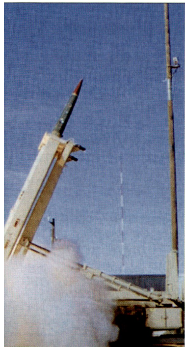
Test mit dem Luftverteidigungssystem THAAD.

gon weiterhin auf den regelmässigen Einsatz der Reserve angewiesen (siehe auch ASMZ 3/2007, Seite 40). Früher durfte ein Army-Reservist für einen gegebenen Konflikt maximal 24 Monate aktiviert werden. Diese Beschränkung wurde nun aufgehoben. Denn ein hoher Anteil der Kampf- und Unterstützungsverbände der Army-Reserve und Nationalgarde haben bereits 18- bis 20-monatige Einsätze im Irak oder teilweise auch in Afghanistan hinter sich. Gezwungenermassen müssen jedoch einige dieser Einheiten demnächst wieder in den Mittleren Osten entsandt werden, um die im Irak geforderte Kräftepräsenz aufrechtzuerhalten. hg ■