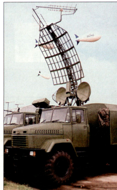
Mobiles Radarsystem «Kolchuga» an einer Rüstungsausstellung.

Beim mobilen Radarsystem «Kolchuga» handelt es sich um ein passiv arbeitendes Funkmess-Überwachungssystem, das im Rahmen der bodengestützten Luftverteidigung eingesetzt werden kann. Das leistungsfähige System kann alle Emissionen von Flugzeugen (Funk, Radar, Navigationssignale usw.) erfassen, analysieren und identifizieren. Dabei werden keine eigenen elektromagnetischen Wellen ausgestrahlt, wodurch eine Aufklärung der Station erschwert wird. Das «Kolchuga»-System besteht aus einem Antennenkomplex mit vier Antennen, die in unterschiedlichen Frequenzbereichen arbeiten. Diese