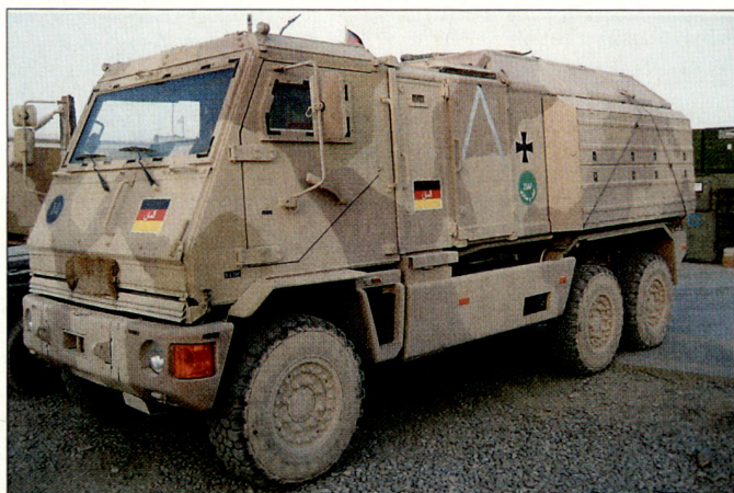
Der in Kooperation zwischen Mowag und Rheinmetall hergestellte «Yak» resp. «Duro 3» erfüllt die gestiegenen Anforderungen des Heeres an geschützte Transportfahrzeuge.

einen wesentlichen Beitrag zum optimierten Schutz der Soldaten im Einsatz und gleichzeitig auch zur Vereinheitlichung der Fahrzeugflotten. Der «Yak» (Duro 3) gewährleistet seinen Besatzungsmitgliedern ballistischen Schutz sowie Schutz gegen seitliche Ansprengungen durch IEDs und verfügt auch über einen integrierten Minenschutz. Bei der deutschen Bundeswehr befindet sich der «Yak» in den Varianten BAT (beweglicher Arzttrupp), Bodenkontrollstation «LUNA» (für Drohnensystem), EOD (Kampfmittelbeseitigung) und Feldjäger im Einsatz. Mit dem erhöhten Bedarf und den gestiegenen Anforderungen des Heeres an geschützten Transportraum dürften in den nächsten Jahren weitere Beschaffungen folgen. Auch andere Armeen sind in verstärkter Masse an diesem Fahrzeug interessiert. hg