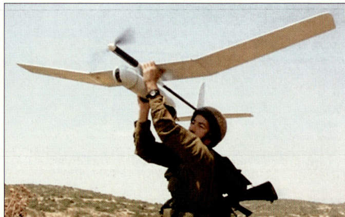
Das Drohnensystem «Skylark» steht bei der israelischen Armee sowie bei Streitkräften mehrerer NATO-Staaten im Einsatz.

Gemäss vorliegenden Informationen hat die australische Armee im Jahre 2005 bei Elbit sechs Systeme «Skylark I» gekauft und diese bereits kurz darauf ihren Truppen im Süden des Irak zur Verfügung gestellt. Im Weiteren sollen auch die kanadischen sowie die niederländischen Truppen bei der ISAF (International Security Assistance Force) in Afghanistan über «Skylark»-Drohnen verfügen. Das niederländische Kontingent soll diese Aufklärungsmittel zusammen mit den zehn «Aladin»-Mini-UAVs für dringende Missionen einsetzen.