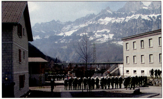
Punktuelle Konzentration: Militärpolizei beim Ordnungsdienst.

schlagartig erhöht wird. Ordnungsdienstformationen der Militärpolizei beispielsweise sehen aus wie römische Kohorten, die Soldaten stehen Schulter an Schulter. Dies ist jedoch nicht die Regel, sondern die Ausnahme. Sowohl in der Existenzsicherung als auch in denkbaren Raumsicherungsszenarios ist die Truppendichte weit aus geringer als in der Verteidigung. Das hat Konsequenzen.