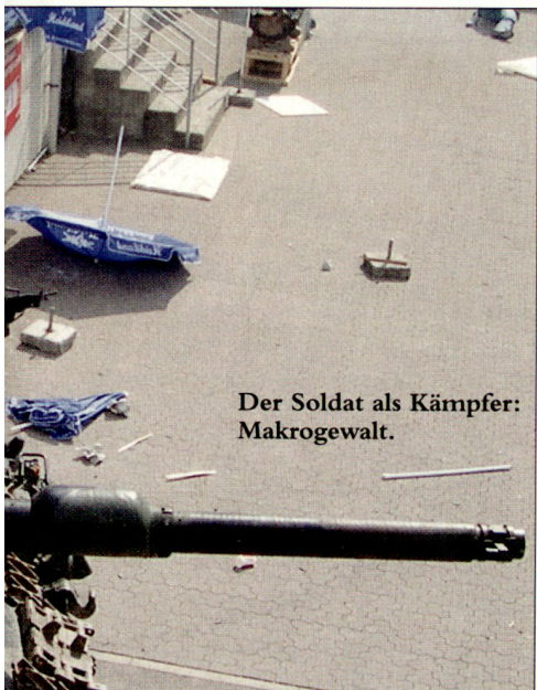
Der Soldat als Kämpfer: Makrogewalt.