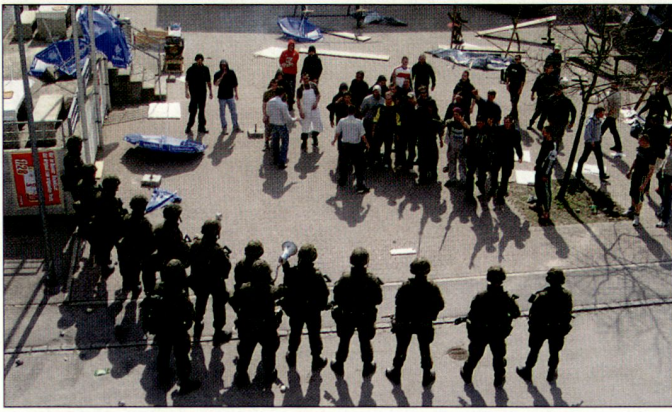
Punktuelle Konzentration: Infanterie steht unfreundlicher Menschenmenge gegenüber.