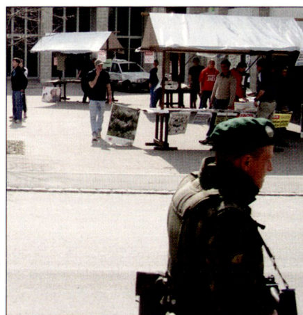
Der einsame Soldat auf Patrouille.

Heute ist das anders. Nicht mehr das Gefechtsfeld mit vorbereiteten Stellungen,