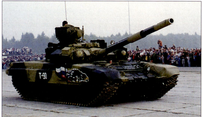
Russland wird in nächster Zeit weitere Panzer T-90S an Indien liefern.

des Volumens kann durch die Herstellerfirmen selber verkauft werden. Die russische Regierung versucht seit einiger Zeit, mit der Schaffung von Holdinggesellschaften und mittels Teilprivatisierung der Rüstungsbetriebe die marktwirtschaftlichen Strukturen im MİK zu verbessern. Diese Anstrengungen sind aber bisher mehrheitlich im Sande verlaufen,