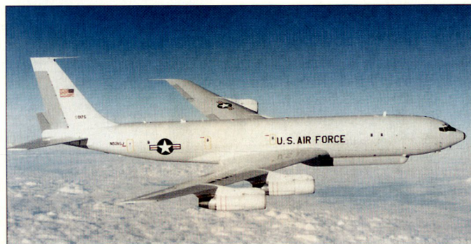
Überwachungsflugzeug E-8C «Joint STARS» der US Air Force.

35 Jahren. Vorgesehen ist nun der Einbau modernerer Triebwerke vom Typ JT8D-219. Bis zum Beginn des nächsten Jahres wird die Firma Northrop Grumman ihr eigenes Testflugzeug mit den neuen Triebwerken ausrüsten und anschliessend die vorgesehenen weiteren Modernisierungen vornehmen. Gemäss vorliegenden Planungen soll das ganze Programm bis 2013 abgeschlossen sein. Nebst einer generellen Aufdatierung der vorhandenen Führungs- und Überwachungssysteme soll das Radar mit der Fähigkeit ausgestattet werden, der Führung Präzisionszielradar zu liefern. Zudem soll die ganze «Joint STARS»-Flotte künftig den internationalen Lärm- und Abgasvorschriften entsprechen. hg