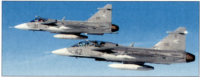
Kampfflugzeuge JAS-39C und D «Gripen» bei der ungarischen Luftwaffe.

39 «Gripen» geplant. Ein entsprechend modernisierter Demonstrator soll bereits im Jahre 2008 die Flugversuche aufnehmen. Die Entwicklung erfolgt in Zusammenarbeit zwischen den Firmen