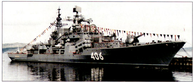
Dank russischen Lieferungen konnte China in letzter Zeit seine Marinestreitkräfte ausbauen; Bild Lenkwaffenkreuzer der Sovremenny-Klasse.

lenfalls weitere 40 Helikopter produziert werden. Noch muss aber zugewartet werden, bis von einer definitiven Beschaffung des Kampfhelikopters A129 gesprochen werden kann. hg