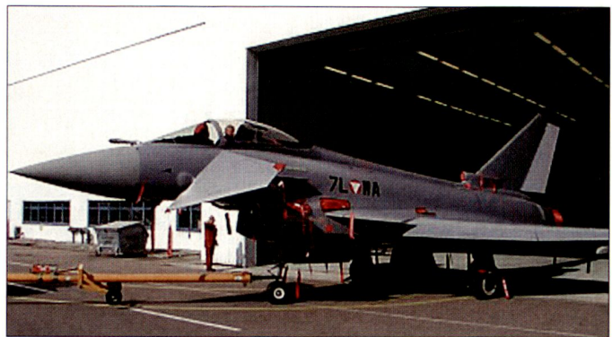
Der erste Austria-«Typhoon» vor seinem Erstflug.

Infolge der neuesten Steuerschätzung, nach der bis 2011 insgesamt 190 Mrd. Euro mehr Steuereinnahmen zu erwarten sind, gibt es aus den meisten Ressorts neue Begehrlichkeiten. Beide Fraktionen der Regierungskoalition betonen die Priorität des Schuldenabbaus. Ob für die Bundeswehr etwas übrig bleibt, ist abzuwarten. Tp.