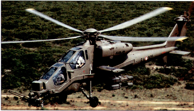
Der Kampfhelikopter A129 «Mangusta» steht bisher nur bei den italienischen Streitkräften im Einsatz.

immer vorausgesetzt, dass die technischen Probleme im Zusammenhang mit der vorgesehenen Lizenzproduktion zeitgerecht gelöst werden können.