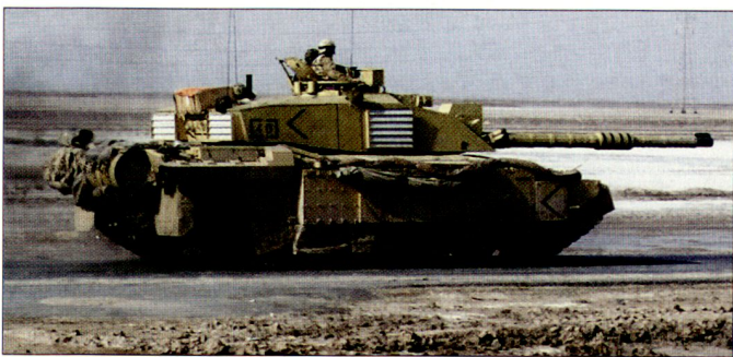
Im Verlaufe des Einsatzes britischer Truppen im Irak wurden an den Panzern «Challenger 2» diverse Schutzverbesserungen vorgenommen.

Gemäss britischen Angaben soll mit den geplanten technischen Massnahmen ein Einsatz der «Challenger 2» im breiten Spektrum künftiger militärischer Aufgaben gewährleistet werden; dies betrifft insbesondere auch Einsätze im urbanen Umfeld. Die Operationen im Irak hätten aufgezeigt, dass bei solchen Stabilisierungsaufgaben neben leichten und mittleren Kräften in gewissen Situationen auch schwere gepanzerte Mittel dringend notwendig sind. Allerdings müssen heute bei den vorhandenen Kampffahrzeugen diverse technische Anpassungen vorgenommen werden. hg