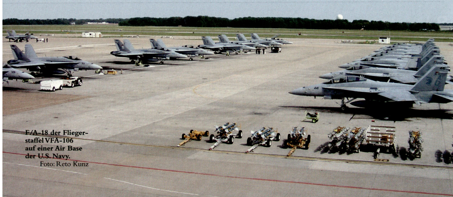
F/A-18 der Fliegerstaffel VFA-106 auf einer Air Base der U.S. Navy.

Die Begründung dafür wurde von der ersten Minute der Ausbildung klar: Das ganze System ist auf Operationen ab Flugzeugträger im nicht immer friedlichen