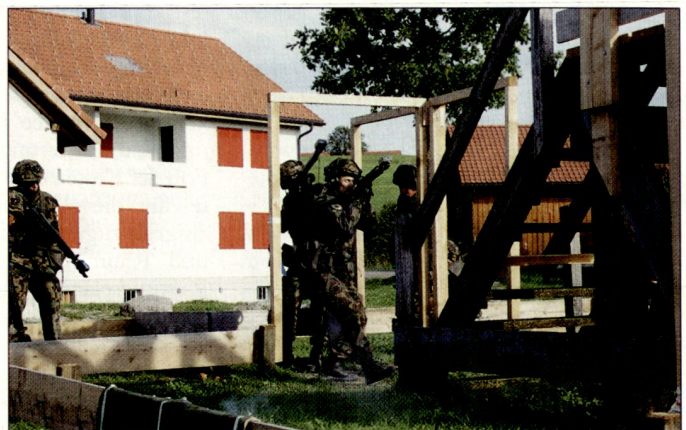
Vorrücken im Häusermodell.