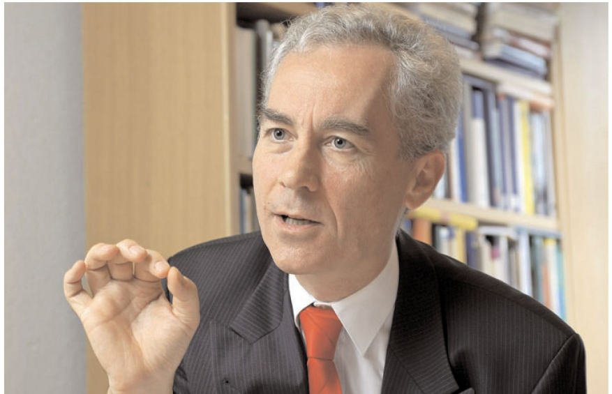
... es auf den Punkt bringen ...

Truppenübungen prägen von allem Anfang an unsere Arbeit. Im Jahre 2004