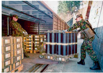
Abbildung oben: Munitionsverlad für den Bahntransport.

Nach einem minimalen Verbandstraining auf Stufe Gruppe und Zug sind die Nachschubelemente in der Lage, echte