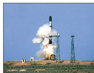
Test einer ICBM vom Typ RS-24.

befindet sich unter der Bezeichnung RS-24 (SS-X-29) eine neue ICBM in Entwicklung. Dabei dürfte es sich um eine verbesserte Version der «Topol-M», die mit Mehrfachsprengkopf versehen ist, handeln. Gemäss Aussagen des Befehlshabers der strategischen Raketenruppen, Generaloberst Nikolai Solowzow, sollen die ersten RS-24 bereits im kommenden Jahr in Dienst gestellt werden. Bei den bisher durchgeführten Testflügen wurden in der Regel die neuen Lenkwaffen vom Weltraumbahnhof Plessezk in Nordrussland abgefeuert und in ein rund 6000 km entferntes Zielgebiet auf der Pazifikinsel Kamtschatka geschossen. Gemäss russischen Angaben sollen in diesem Jahr weitere Testversuche folgen, wobei vor allem die Zielgenauigkeit der MIRV (Multiple Independently targetable Re-entry Vehicles) getestet werden soll.