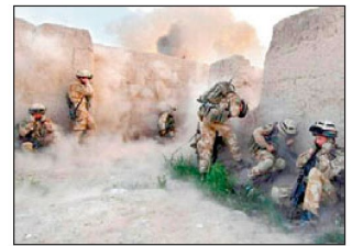
Truppen der «Royal Marines» im Kampfeinsatz.

lich verstärkt, von rund 3300 Soldaten Anfang 2006 auf heute etwa 7800. Im Verlaufe dieses Frühjahres wurde als Verstärkung und Ablösung anderer Einheiten das Gros der britischen 16. «Air Assault Brigade» in den Süden Afghanistans verlegt. Für diesen Verband ist es bereits der dritte Einsatz in dieser Krisenregion; Teile dieser Brigade waren bereits im Jahre 2002 in der Region Kabul und vier Jahre später im Süden Afghanistans stationiert. Die Brigade soll dies-