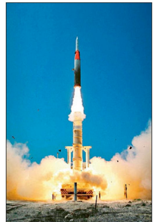
«Arrow-2» bei einem Testversuch.

Die operationellen Feuer-einheiten «Arrow-2» bestehen aus einer Kommando- und Einsatzzentrale, aus einem Zielsuch- und Feuerleitradar vom Typ «Green Pine», den benötigten Kommunikationssystemen sowie den Startvorrichtungen. Das verwendete