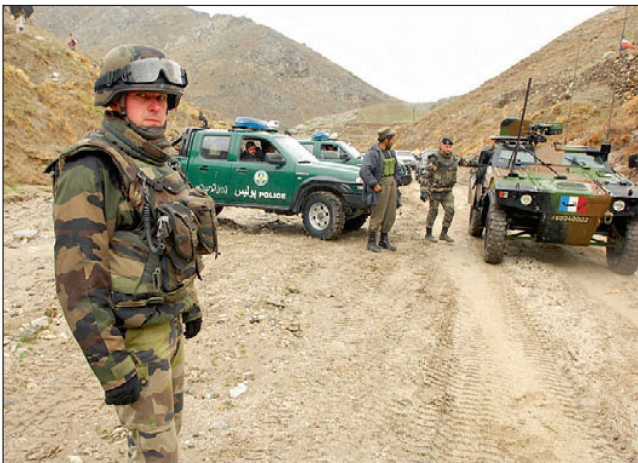
Französische Patrouille in Afghanistan.

pen in den Osten Afghanistans entsendet werden. Dort sind bisher praktisch nur US-Kräfte stationiert, die im Gegenzug vermehrt in den umkämpften Süden verlegt werden sollen. In diesem Sommer wird Frankreich auch die Führung im Regionalkommando «Capital», d.h. in der Region Kabul von Italien übernehmen. Neben Frankreich und Italien ist in diesem Sektor auch die Türkei mit rund 1500 Soldaten engagiert.