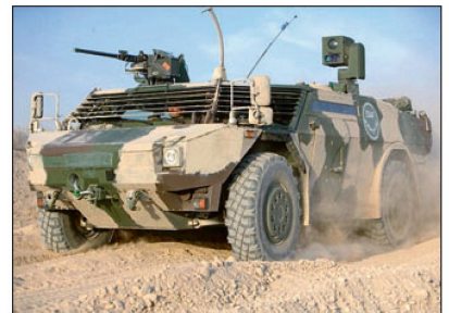
Spähwagen «Fennek» bei einem Aufklärungseinsatz.