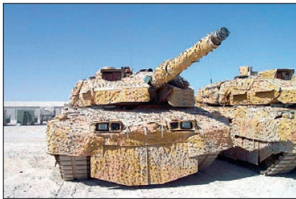
Dänische Kampfpanzer «Leopard 2» in Afghanistan.

Der vom deutschen Ingenieur-Büro Deisenroth vorgestellte, modifizierte «Leopard 2 A4 Evolution» ist ein weiteres Beispiel, der gegenwärtig laufenden Weiterentwicklung von Kampfpanzern. Der Irak-Krieg und der Truppeneinsatz in Afghanistan haben in letzter Zeit ein Um-