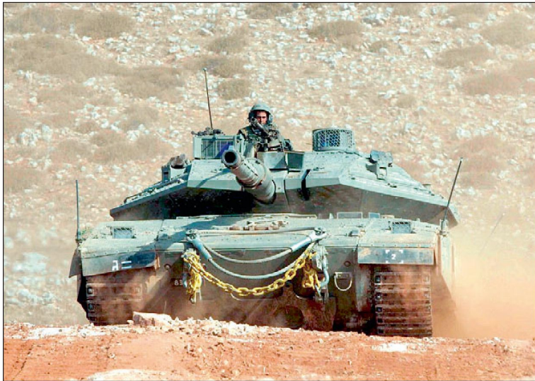
Israelischer Kampfpanzer «Merkava IV».

Die neueste Version «Merkava IV BAZ» verfügt über ein neues Feuerleitgerät sowie über wesentlich verbesserte interne Aufklärungs- und Beobachtungsmittel. Unterdessen wurde von der Herstellerfirma IMI (Israel Military Industries) unter der Bezeichnung «Merkava IV LIC» (Low Intensity Conflict) eine weitere modifizierte Version vorgestellt. Mit den geplanten Optimierungen soll dieser Panzer noch besser für Einsätze im urbanen Gelände und beim Kampf gegen asymmetrische Bedrohungen gerüstet sein. Wesentliche Massnahmen sind dabei der Schutz offener