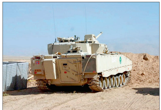
Schützenpanzer CV-90 des norwegischen Kontingents.

Trotz finanzieller Engpässe sollen den Truppen in Afghanistan auch verbesserte materielle Mittel zugeführt wer-