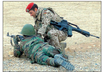
Ausbildung afghanischer Sicherheitskräfte.

letalen Mitteln unter Kontrolle zu halten. Darüber hinaus sollen im Bedarfsfall auch Evakuierungsoperationen durchgeführt und eigene Kräfte in der Region kurzfristig verstärkt werden. Geraten deutsche oder alliierte Soldaten durch militante Kräfte in eine Notlage, können Teile dieser schnellen Eingreiftruppe eingesetzt werden, um diese zu befreien und die Sicherheit wiederherzustellen. Um möglichst autonom handeln zu können, verfügt die Einheit unter anderem über eigene Logistikkraft, Spezialisten für die Kampfmittelbeseitigung und moderne Kommunikationsmittel.