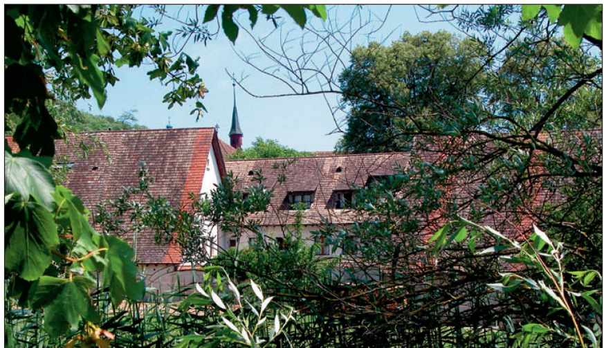
Vor den Toren der Stadt Frauenfeld: Die Kartause Ittingen.

Ideale Voraussetzungen finden die Sportbegeisterten. Den Wassersportlern bieten Hallen-, Sprudel- und geheizte Freibäder ideale Voraussetzungen. In den Sporthallen- und Anlagen der Kantonshauptstadt können auch internationale