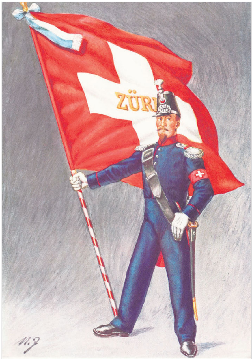
Bild 4: Eidgenössische Bataillonsfahne 1852 mit Kantonsbezeichnung im Querbalken des Kreuzes und Schleife in den Standesfarben. Der Fähnrich trägt das damalige Feldzeichen, die eidgenössische Armbinde.

Die ab 1830 bei der Armee eingeführten neuen Militärfahnen fanden auch im zivilen Umfeld eine immer grössere Verbreitung (Bild 5) und wurden zu unserer Landesfahne. Weil die Schweizerfahne, aus den Militärfahnen hervorgegangen ist, weist sie – zusammen mit der Fahne des Vatikanstaates – als einzige auf der Welt eine quadratische Form auf.