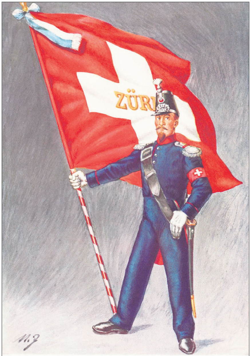
Bild 4: Eidgenössische Bataillonsfahne 1852 mit Kantonsbezeichnung im Querbalken des Kreuzes und Schleife in den Standesfarben. Der Fähnrich trägt das damalige Feldzeichen, die eidgenössische Armbinde.

Die ab 1830 bei der Armee eingeführten neuen Militärfahnen fanden auch im zivilen Umfeld eine immer grössere Verbreitung (Bild 5) und wurden zu unserer Landesfahne. Weil die Schweizerfahne, aus den Militärfahnen hervorgegangen ist, weist sie – zusammen mit der Fahne des Vatikanstaates – als einzige auf der Welt eine quadratische Form auf.