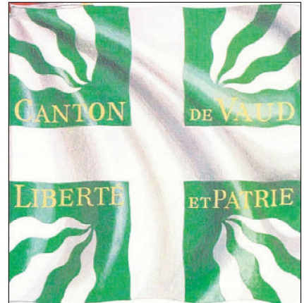
Bild 3: Militärfahne nach dem Allgemeinen Militär-Reglement von 1817: Waadtländer Bataillonsfahne von 1819 mit durchgehendem Kreuz und rot/weisser Schleife.

Das Reglement von 1852 über die «Bekleidung, Bewaffung und Ausrüstung des Bundesheeres» bestimmte: «Alle Truppenabteilungen im eidgenössischen Dienst führen ausschliesslich die eidgenössische Fahne.» 12 (Bild 4). Nach diesem Reglement wurde neu auch jeder Schwadron eine Kavallerie Standarte zugeteilt. 13