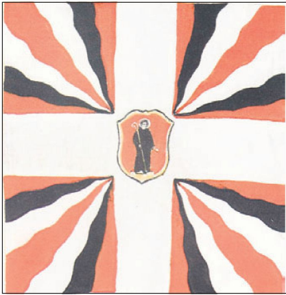
Bild 1: Flammenmusterfahne wie sie vom 17. bis Mitte des 19. Jahrhunderts verwendet wurde: Glarner Militärfahne aus dem 18. Jahrhundert.