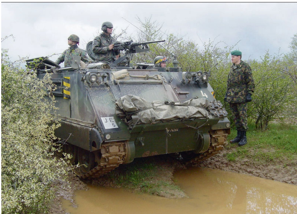
Besuch bei Pz Mw Kp 5/11 in Bière (WK 2005).

Offiziersschule 1985 (Inf OS Bern) Kommandos und Funktionen 1985–1990 Mitr Zfhr (Mot FüS Kp III/50) 1991–1994 Kp Kdt (Mot FüS Kp I/49) 1995–1998 Gst Of (Stab F Div 5, C Op) 1999–2005 Bat Kdt (Füs Bat 49 resp. Inf Bat 11 A) 2006–2007 Gst Of (Stab Inf Br 5, G 5) seit 2008 Br Kdt Stv (Inf Br 4)