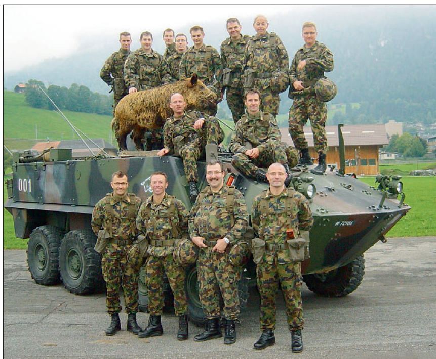
Stab Inf Bat 11 (WK 2005).

Die Schweizerische Offiziersgesellschaft muss sich immer wieder als kompetenter Gesprächspartner anbieten und auf sich aufmerksam machen. So waren zum Beispiel die von der SOG durch meinen Vorgänger organisierten Parlamentariergespräche wirkungsvolle und