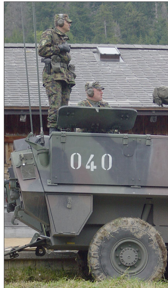
Kp-Gefechtsschiessen auf dem Hongrin Inf Bat 11 (WK 2005).

In unserer Brigade wurde der aktualisierte Wachtbefehl bisher problemlos