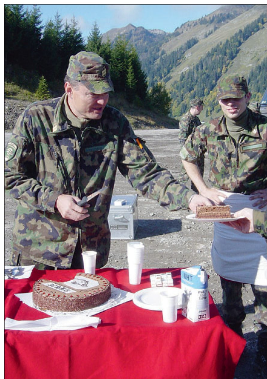
Kommandantenkuchen auf dem Hongrin Inf Bat 11 (WK 2005).

Ich bin dagegen, dass die persönliche Waffe zwischen den Dienstleistungen im Zeughaus deponiert wird. So tragisch vereinzelte Missbräuche der persönlichen Waffe auch sind, so wenig ändert dies etwas an der Tatsache, dass solche Missbräuche nur sehr selten geschehen und letztlich nicht verhindert werden können. Eine Aufbewahrung der persönlichen Waffe im Zeughaus bedeutet nicht nur einen erheblichen logistischen und zeitlichen Aufwand für die Armee und die Truppe, der zulasten der ohnehin knappen Ausbildungszeit geht, sondern stellt einen ungerechtfertigten Misstrauensbeweis gegenüber unseren Wehrmännern dar. ■