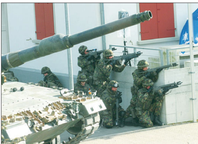
Abb 5: Force-Mix auf unterster Stufe.

Der Übergang zwischen den Operationstypen Existenzsicherung, Raumsicherung und Verteidigung ist fließend.