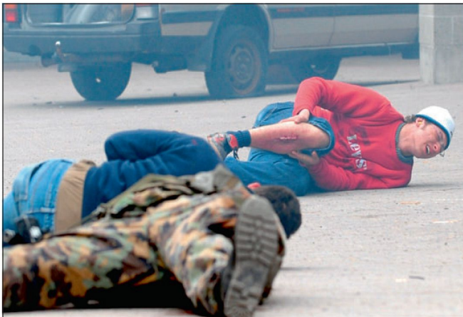
Abb 2: Umgebung Zivilbevölkerung.