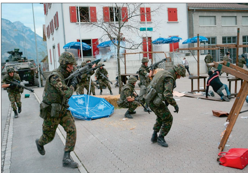
Abb 4: Switch.

Die umfassende Tasklist in der Ergänzung Raumsicherung zur Taktischen Führung XXI (Regl 51.020.1, Anhang 3) setzt dabei die Leitplanken für die konkrete taktische Umsetzung. In der Raumsicherung eingesetzte Verbände müssen in der Lage sein, das ganze Spektrum von Schutz- und Kampfaufgaben abzudecken. Das Spektrum der taktischen Aufgaben beginnt im Schutzbereich mit Überwachung und endet im