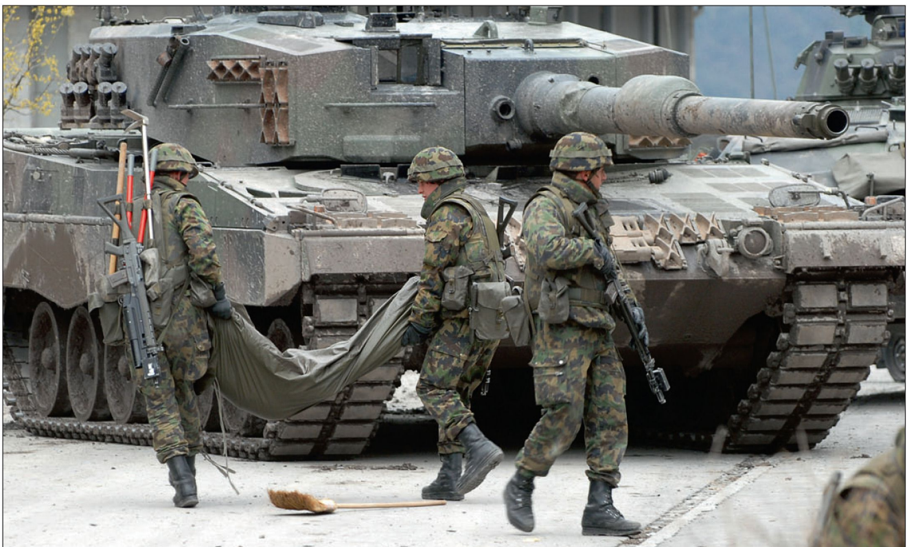
Abb 7: Politische Verantwortung.

- Stabsübungen auf operativer Stufe müssen in realen Landes-, Kantons- und Territorialregionsgrenzen stattfinden. Zivile Verantwortungsträger dürfen nicht mit Rollenspieler simuliert werden. Da sich die Gegenseite nicht um geografische Grenzen kümmert, kann das reale europäische Umfeld dargestellt werden, in dem die Schweiz und damit auch ihre politischen und militärischen Exponenten so üben, wie sie wirklich antreten müssten: Mit dem Wissen und der vollen Verantwortung, dass die in Übungen getroffenen Entscheide medial bewertet werden und damit zu Höchstleistungen anspornen. Wer das scheinbar Unmögliche denkt, ist dann einen Schritt voraus, wenn es tatsächlich eintritt. ■