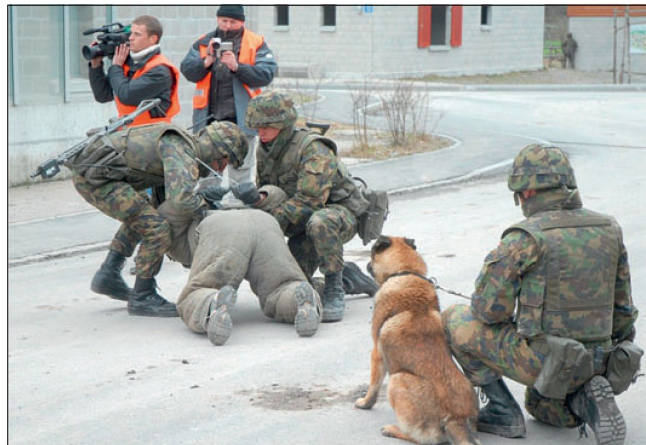
Abb 3: Mediales Umfeld.