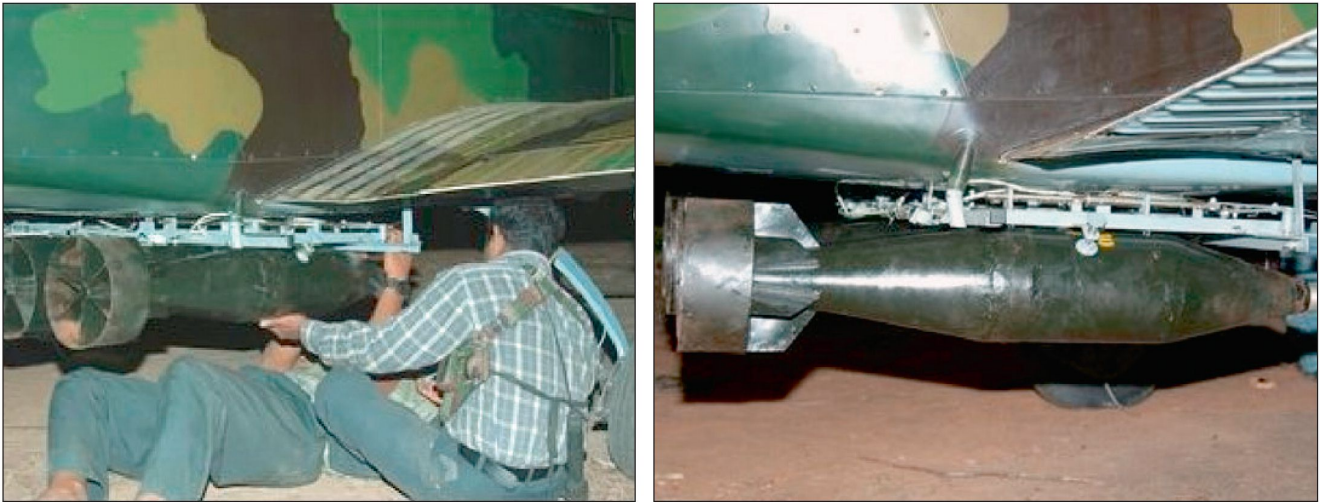
Abb. 1+2: Einfache Aufhängung von Bomben an einer LTTE Zlin-Z143, einem tschechischen Schulungsflugzeug.