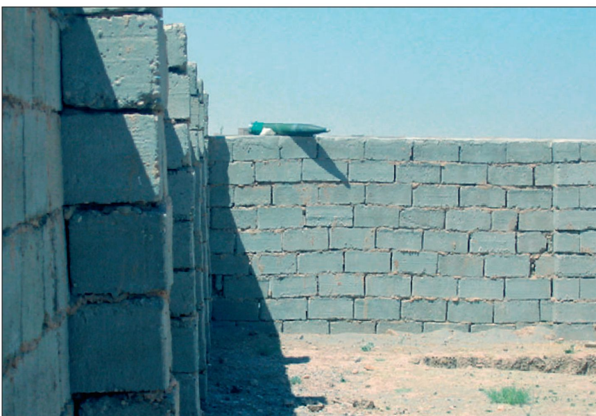
Abb. 3: Improvisierte Abschussvorrichtung für eine Katyusha-Rakete in Afghanistan.

Um die lokale Luftlage lückenlos und umfanglich zu generieren, müssen zusätzliche Radare in die engen Täler platziert werden. Diese müssen auch imstande sein, Flugobjekte mit sehr kleinen Radarquerschnitten 7 zu erfassen. Dies ist notwendig, um Flugobjekte (beispielsweise Modellflugzeuge), welche auch im Raum selber gestartet werden können, zu erkennen. Diese Aufgabe kann vom übergeordneten Luftlagesystem FLORAKO nicht in der geforderten lokalen Qualität erledigt werden. Es ist also nahe