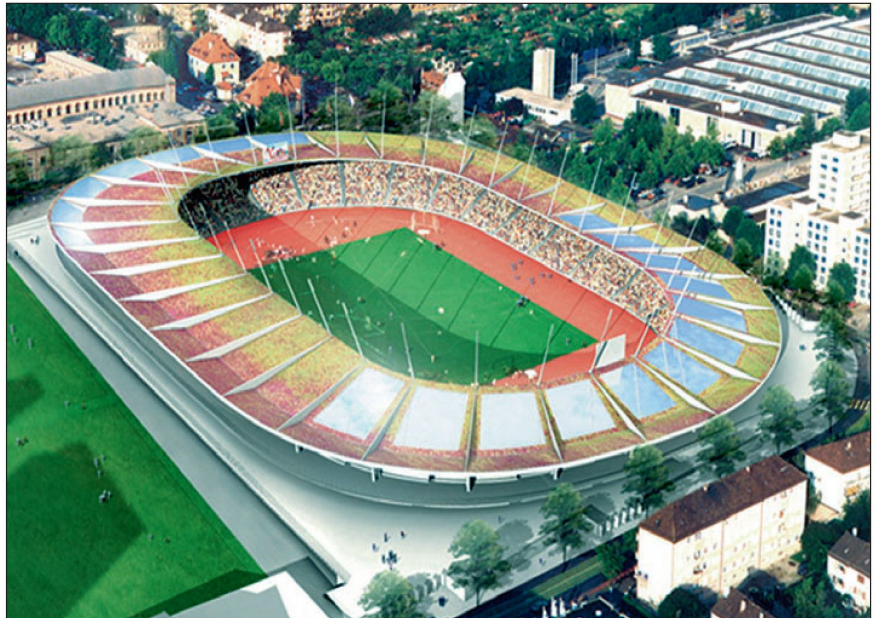
Das neue Letzigrund-Stadion besticht durch seine Eleganz.

Glücklicherweise können wir seit einiger Zeit an diesem Objekt bereits trainieren. Eine Stabsrahmenübung und eine grosse Einsatzübung wurden mit allen Kräften der polizeilichen und nichtpolizeilichen Gefahrenabwehr so-