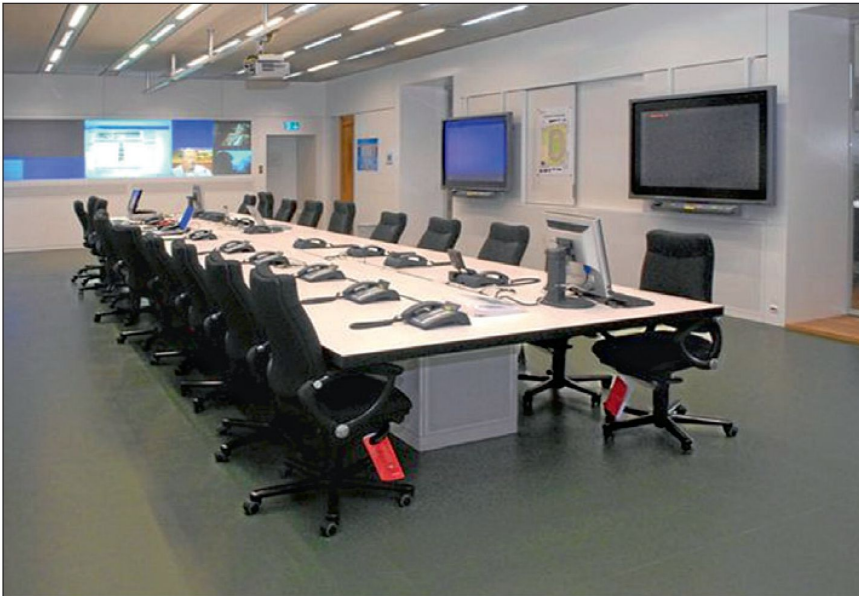
Rechtzeitig vor der EURO 08 nahm der Führungsraum seine neue Gestalt an, ausgerüstet mit den modernsten Arbeitsmitteln, auch für Übermittlung und Lagedarstellung.

keine nennenswerten Reserven mehr verfügbar sind, worauf bei unvorhergesehenen, grösseren Ereignissen zurückgegriffen werden könnte. Deshalb stellen das Ostschweizerische Polizeikonkordat sowie die Kantonspolizei Tessin zugunsten aller vier Host Cities eine abrufbare Einsatzreserve. Für Grosse Ereignisse und Katastrophen gibt es ein spezielles Konzept (Führung in beson-