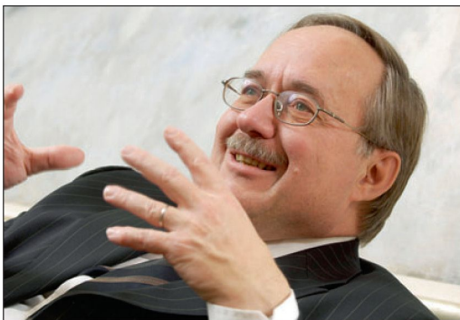
Bundesrat Schmid in entspannter Stimmung.

Der neue, angepasste Sicherheitspolitische Bericht ist eine Herausforderung. Zwischen- und innerstaatliche Konflikte können im Inland herkömmliche äussere und innere Sicherheitsprobleme vermischen, beispielsweise durch Migration in unser Land importierter Auseinandersetzungen. Die Trennung innere und äussere Sicherheit ist verschwommen.