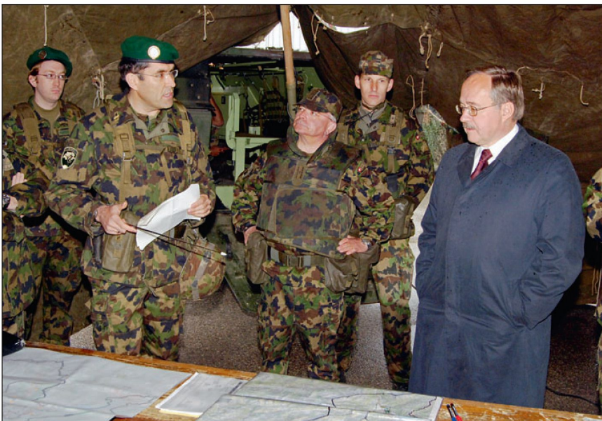
Bunderrat Schmid im Lagezentrum der Übungstruppe.

noch intensiviert werden. Und schliesslich gilt es die Anerkennung einer militärischen Führungslaufbahn in der Gesellschaft zu fördern. Letztlich ist die Nachwuchsförderung aber auch Chefsache und muss durch die Kommandanten aktiv geführt werden. Diese Verantwortung lässt sich nicht delegieren.