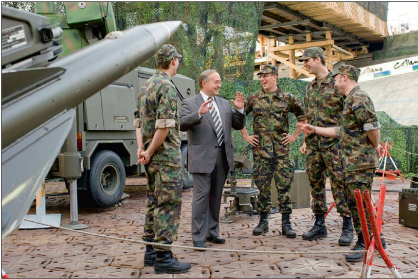
Bunderrat Schmid im Gespräch mit Soldaten.