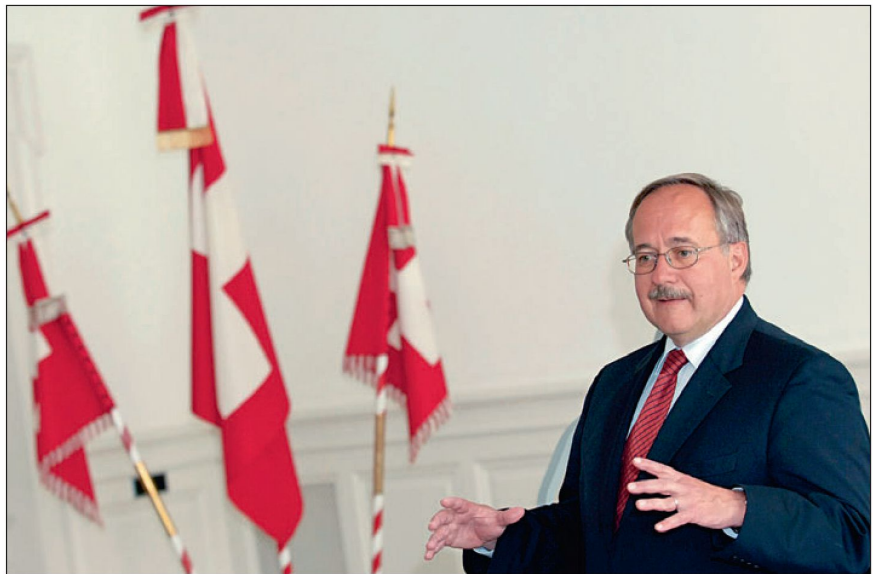
Bundesrat Schmid bei einer engagierten Ansprache.

Von einem Scheitern kann noch keine Rede sein. Die Bilanz gilt es am Schluss des ganzen Prozesses zu ziehen. Ich erinnere an den Entwicklungsschritt 08/11, der zu Beginn in Flims abgelehnt wurde. Ich weise zudem darauf hin, dass der Nationalrat in der Gesamtabstimmung die Vorlage wegen der Änderung verworfen hat. Nun geht das Geschäft in den Ständerat, der nach heutiger Beschlusslage der Meinung seiner Sicherheitspolitischen Kommission folgen wird.