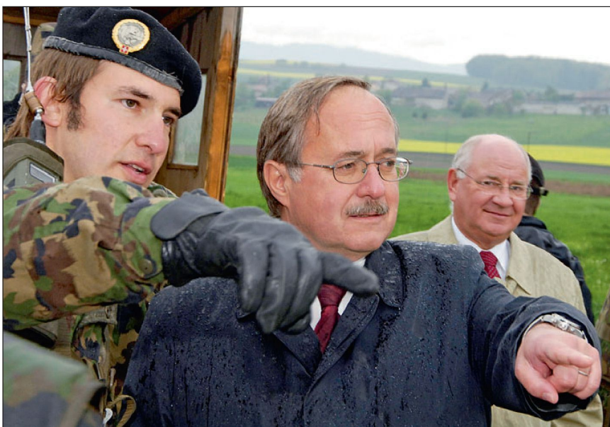
Bundesrat Schmid auf Truppenbesuch.