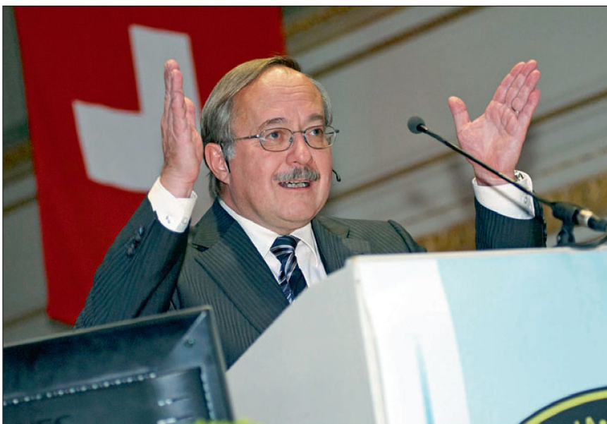
Bundesrat Schmid am Jahresrapport des FSTA.

Die Armee wird vermehrt in der inneren Sicherheit eingesetzt. Weshalb fehlt bis heute ein Kapitel über die innere Sicherheit im Sicherheitspolitischen Bericht?