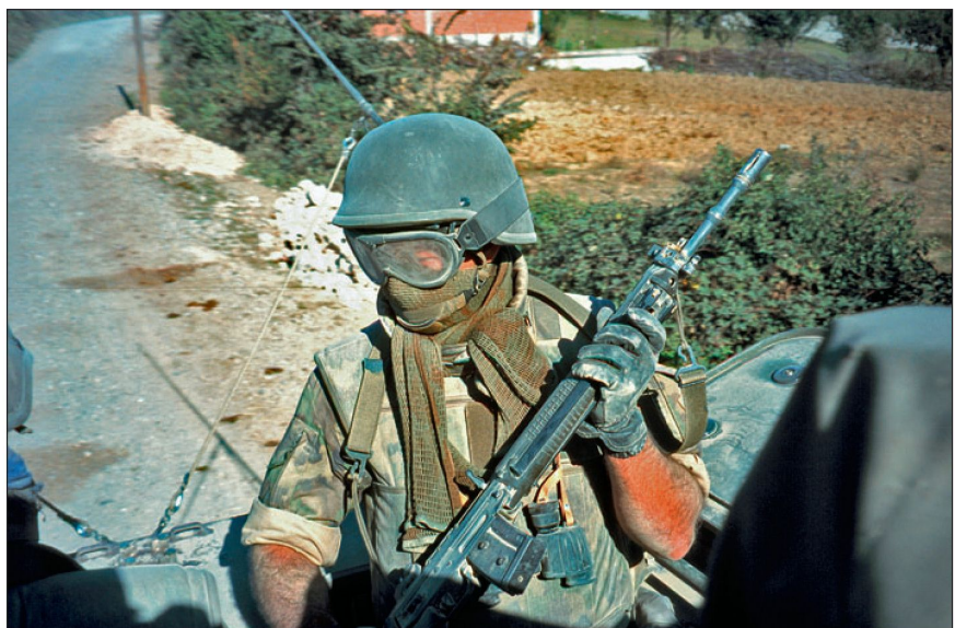
Der heisse und staubige Einsatzraum fordert Mensch und Material.