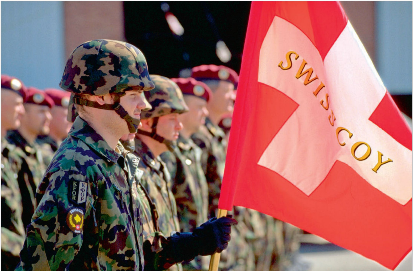
Die SWISSCOY steht mit maximal 220 Mann im Rahmen je einer Infanterie und einer Supportkompanie im Einsatz.