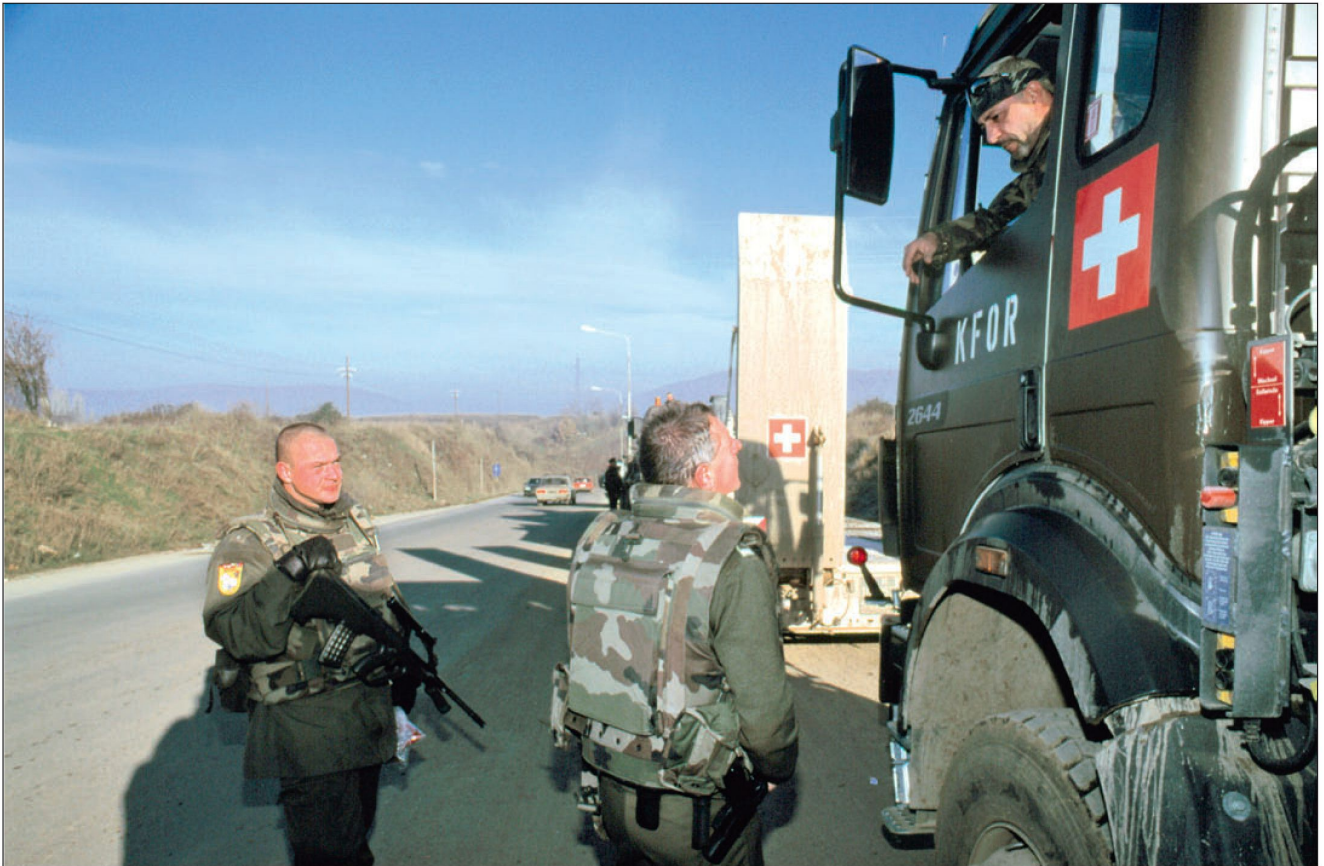
Nebst den Sicherungseinsätzen stellt SWISSCOY mit ihren schweren Genie- und Transportausrüstungen wichtige Kapazitäten für den CIMIC-Bereich zur Verfügung.