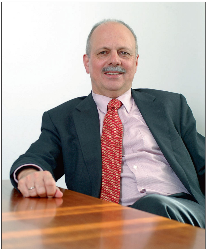
Wer dazu befähigt ist, hat die Pflicht, Offizier zu werden.

Der Chef VBS fordert in Bezug auf die Weiterentwicklung der Armee «mehr Gegenwart und weniger