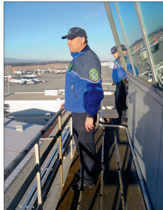
Die Police de Sûreté internationale (PSI) – direkter Ansprechpartner der Armee.

Sehr ermutigend ist, dass die Zusammenarbeit der verschiedenen Partner – der Genfer Regierung, der Kantonspolizei Genf, dem Aéroport International de Genève-Cointrin, der Police de Sûreté Internationale, der Armee und einer Reihe weiterer Partner, wie Skyguide – professionell funktioniert. Man hat sich gegenseitig als vollwertige und echte Partner schätzen gelernt. Dieses gegenseitige Vertrauen ist aber mit gezielten, regelmässigen gemeinsamen Übungen zu konsolidieren und zu festigen.