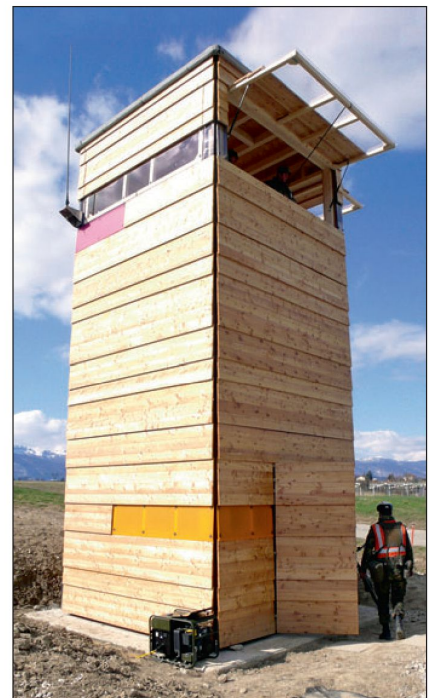
Die neuen Beobachtungstürme, mit modernster Technik ausgerüstet.

Die Übung hatte zum Ziel, die Machbarkeit des aktuellen Planungsstandes praktisch zu überprüfen und allfällige konkrete Korrekturmassnahmen zu definieren und einzuleiten.