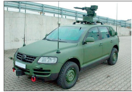
Militärversion des «Touareg».

VW und 20 «Dingo 2» beschafft worden. Für den nächsten Schritt sind 150 Fahrzeuge in der «Dingo»-Klasse ausgeschrieben worden. Darüber hinaus werden 170 kleinere geschützte Fahrzeuge in der «Eagle»-Klasse und 60 grössere 6x6 oder 8x8 Radfahrzeuge gesucht. Dabei steht natürlich eine weitere Beschaffung von gepanzerten Radschützenpanzern «Pandur» von Steyr Spezialfahrzeuge im Vordergrund. Damit soll auch eine möglichst hohe Wertschöpfung auf Österreich konzentriert bleiben. Gemäss Aussagen der Bundesheerführung sollen künftig bei Auslandseinsätzen wenn immer möglich nur noch geschützte oder ge-