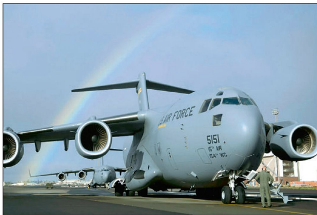
Transportflugzeug C-17 «Globemaster III».

Unterdessen haben auch US-Politiker Stellung bezogen und verlangen eine seriöse Abklärung. Mit umfassenden Untersuchungen und Vergleichsschiessen soll gewährleistet werden, dass die amerikanischen Soldaten künftig mit den besten und zuverlässigsten Waffen ausgerüstet werden.