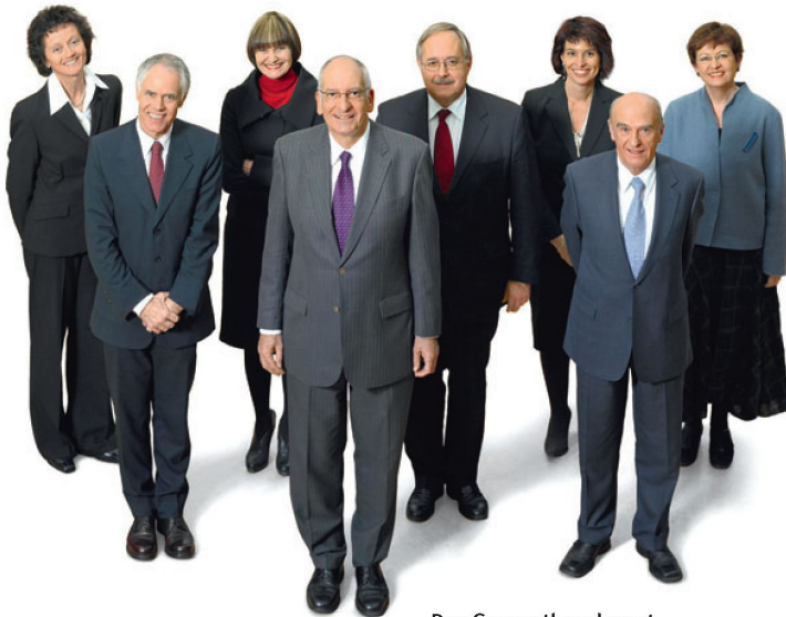
Der Gesamtbundesrat ist gefordert.

und äusserer Sicherheit unterschieden werden kann.