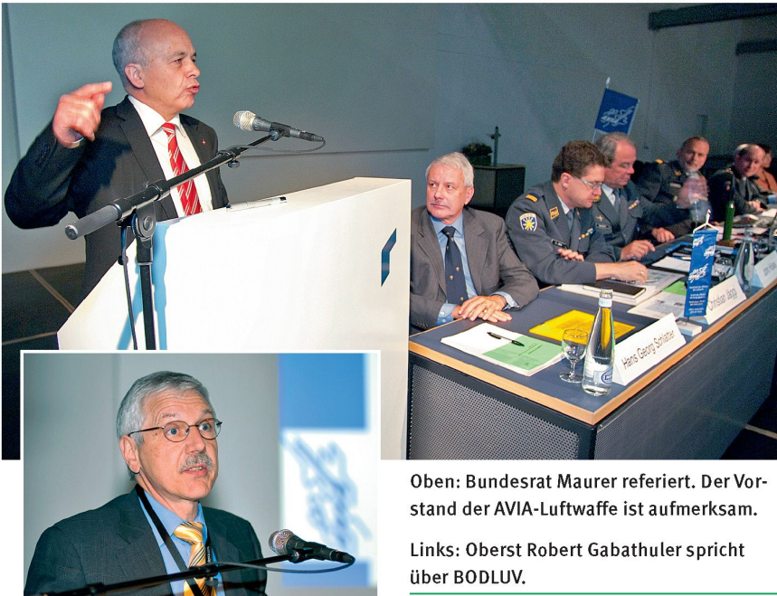
Oben: Bundesrat Maurer referiert. Der Vorstand der AVIA-Luftwaffe ist aufmerksam.