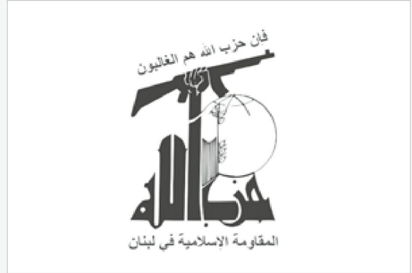
Fahne der Hisbollah (gelbe Grundfarbe).

Hisbollah bedeutet „Partei Gottes“. Sie entstand 1982 kurz nach dem Einmarsch der Israelis im Südlibanon mit Unterstützung Irans und Syriens aus dem Zusammenschluss diverser schiitischer Gruppierungen mit dem Ziel, die israelischen Besetzer im Südlibanon zu bekämpfen. [1] Offiziell wurde sie aber erst 1985 gegründet. Zusammen mit der libanesischen Armee kontrolliert sie den Süden und Nordosten des Libanon. Sie verfolgt im Wesentlichen drei Ziele: [2] Die Amerikaner, die Franzosen und ihre Alliierten definitiv aus dem Libanon zu vertreiben und damit jeder kolonialistischen Entität auf das Land ein Ende zu bereiten. Die Phalangisten [3] einer gerechten Macht zu unterwerfen und sie alle für die Verbrechen, die sie gegen Muslime und Christen [4] begangen haben, der Gerechtigkeit zuzuführen. Allen Söhnen des Volkes ermöglichen, ihre Zukunft zu bestimmen und in aller Freiheit die Form von Regierung zu wählen, die sie haben wollen. Alle sind aufgerufen, die Option der islamischen Regierung zu wählen, die allein Gerechtigkeit und Freiheit für alle garantieren kann. Nur ein islamisches Regime kann jegliche weiteren Versuche einer imperialistischen Infiltration stoppen.