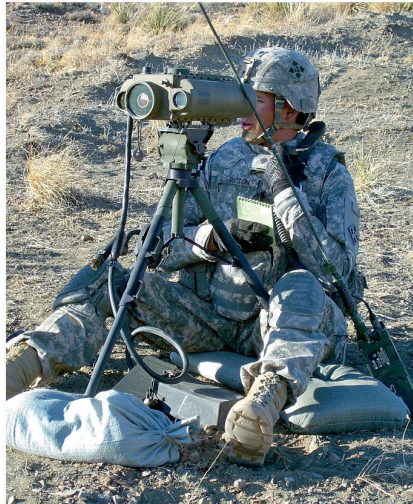
Vermessungssoldat aus Schiesskommandantentrupp im Einsatz.

Operation befand. Der Bedarf an Artilleriefeuer und Einheiten, die fähig sind, dieses Feuer auch zu liefern, stieg damit unweigerlich. Der letzte und nicht weniger wichtige Grund ist, dass der FACCC die letzte Ausbildung ist, in der artilleriespezifisch ausgebildet wird. Der angehende