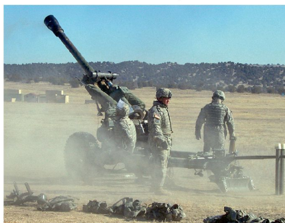
10,5cm Haubitze M119A2 im scharfen Schuss.

and Combined Arms Block ging es darum, die operativen und taktischen Grundlagen zu erlernen, um als Feuerunterstützungsoffizier oder als Stabsmitarbeiter in einem Bataillonsstab eingesetzt werden zu können. Wir wurden dabei im ganzen Spektrum von offensiven, defensiven, stabilisierenden und unterstützenden Operationen unterrichtet. 2 Der Battery Command Block am Schluss des Kurses war darauf ausgerichtet, das Rüstzeug mitzubekommen, um eine Einheit innerhalb der Kasernenmauern in den USA, aber auch im Einsatz irgendwo auf der Welt, führen zu können. Ich hatte nach Abschluss des Kurses in Fort Sill noch zusätzlich die Gelegenheit, während zwei Wochen bei einem Artilleriebataillon zu sein, welches sich in den Vorbereitungen für den bevorstehenden Einsatz befand.