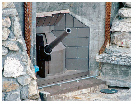
15,5 cm Festungskanone BISON.

der ganzen Schweiz. Mit dem Wegfall des Pz Mw Systems ist der 12 cm Fest Mw das einzige noch verbleibende Waffensystem, das panzerbrechende Mun in den Elevationsbereichen zwischen 900–1200 A o/oo verschiessen kann. Beim Einsatz in der «Unmittelbaren Feuerunterstützung» in der Verteidigung im überbauten Gebiet kommt diesem System eine grosse Bedeutung zu.