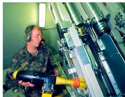
Ladevorgang eines 12 cm Festungsminenwerfers.

Mit der Einführung des «Integrierten Artillerie Feuerführung- und Feuerleitsystem» (INTAFF) wurden die Prozesse im Bereich Feuerführung und Feuerleitung zwischen der Festungsartillerie und den mechanisierten Feurereinheiten vereinheitlicht. 2009 wurde der Feuerleitreechner FARGOF mit dem Einheitsreechner (FARGO 83/05) ersetzt. Somit verfügen alle Bogenschusswaffen über identische Systeme und eine Zusammenlegung der Ausbildung ist gerechtfertigt.