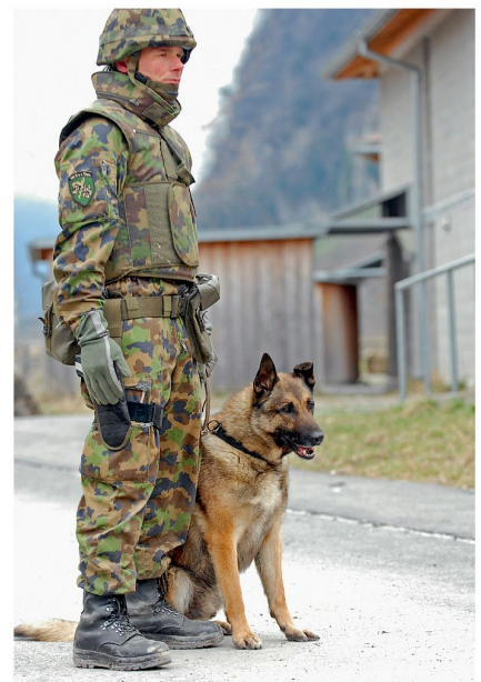
Ob es uns passt oder nicht: Der Strategische Füsilier ist heute Realität.

Bereits 1999 schrieb General Charles C. Krulak (USMC) in einem vielbeachteten Aufsatz: «Micromanagement must become a thing of the past and supervision – that double edged sword – must be complemented by proactive mentoring.» 4 Wenn wir in speziellen Ausnahmesituationen selbstständige Entscheidungen auf der untersten Stufe an die Stelle von Führung durch eine Hierarchie setzen, müssen die Strategischen