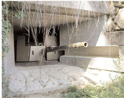
Neueste Anlage: «Centurion-Bunker» im Löwenberg bei Murten. Am Ende des Kalten Krieges erstellt. Turm des Centurion Panzers mit Zusatzpanzerung und Kanone in Feuerstellung.

Im letzten Jahr haben hunderte von Besuchern von diesen Angeboten Ge-