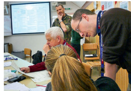
Im Team werden auch die schwierigsten Aufgaben bewältigt.

führung an mehreren Praxisbeispielen geübt und vertieft.