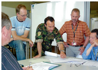
Die erzielten Ergebnisse werden anschliessend genau beurteilt und besprochen.