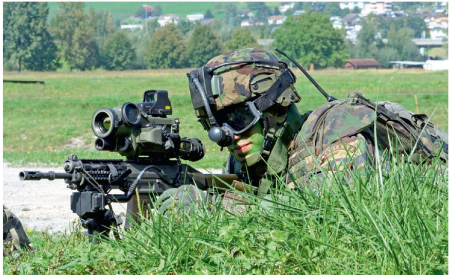
Soldat der Zukunft: Anwendung neuer Technologien.

Die Miniaturisierung ist ein zentrales Anliegen, um Volumen und Gewicht von Einsatzmaterial zu minimieren und die Einsatzmittel hochmobil zu gestalten. In einer möglichen konkreten Anwendung operieren Kleinstroboter als Schwarm sowohl in der Luft als auch am Boden in einem Krisen- oder Katastrophengebiet. Sie stellen die Kommunikation untereinander und für die Einsatzkräfte mit der Leitstelle sicher und klären das Einsatz-