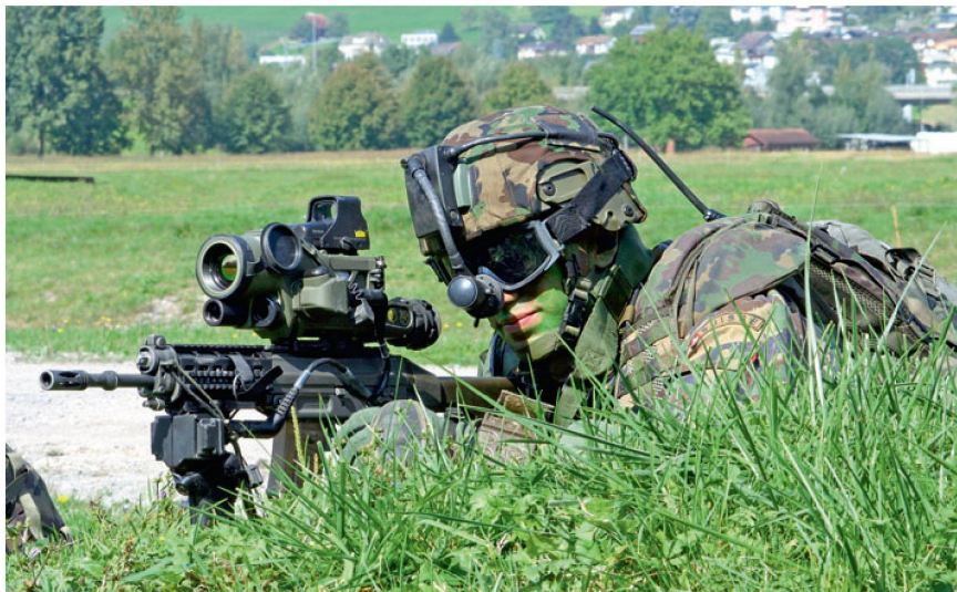
Soldat der Zukunft: Anwendung neuer Technologien.

Die Miniaturisierung ist ein zentrales Anliegen, um Volumen und Gewicht von Einsatzmaterial zu minimieren und die Einsatzmittel hochmobil zu gestalten. In einer möglichen konkreten Anwendung operieren Kleinstroboter als Schwarm sowohl in der Luft als auch am Boden in einem Krisen- oder Katastrophengebiet. Sie stellen die Kommunikation untereinander und für die Einsatzkräfte mit der Leitstelle sicher und klären das Einsatz-