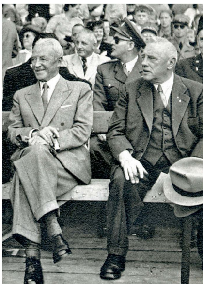
Bundesrat Minger und General Guisan in Saignelégier.

geeigneten Mitteln durchzusetzen, so z. B. das Réduit. Man darf annehmen, dass er als wendige Führungspersönlichkeit der Rolle als Feldherr in der aggressiv geführten Defensive gewachsen gewesen wäre. 5