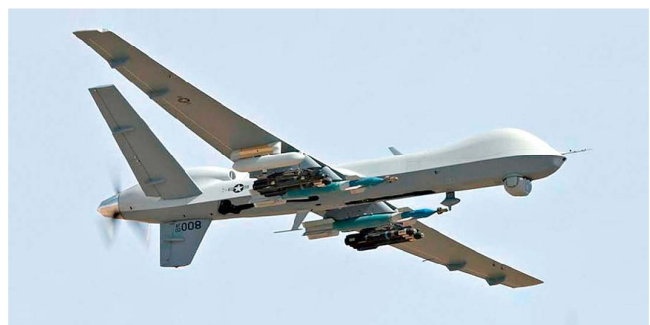
Kampfdrohne MQ-9A «Reaper».

• Truppenansammlungen und erkannte Waffenstellungen. Die eingesetzten UAV's waren anfänglich hauptsächlich mit Luft-Boden Lenkwaffen des Typs AGM-114 «Hellfire» bewaffnet, wobei die MQ-9A bis zu 14 solcher Lenkwaffen mitführen kann. Die von der US Army primär für Aufklärungseinsätze genutzten UAV's vom Typ MQ-1 «Predator» können in der bewaffneten Version mit maximal vier Lenkwaffen bestückt werden. Unterdessen werden Kampfdrohnen «Reaper» vermehrt auch mit Lenkbomben, beispielsweise mit GBU-12 oder auch mit GBU-38 JDAM bewaffnet. Im Frühjahr sollen erste Einsätze mit GPS-gelenkten GBU-49 erfolgreich verlaufen sein. Die maximale Waffenladung bei der MQ-9A «Reaper» soll etwa 2000 kg betragen.