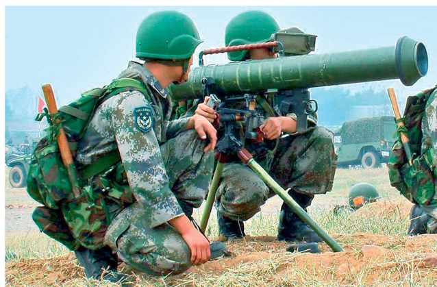
Chinesische Mehrzweckwaffe PF-89.

den beiden staatlichen Rüstungsunternehmen Norinco und Xinshidai hergestellt und zum Verkauf angeboten. Vorhanden sind gemäss chinesischen Angaben thermobarische Munitionstypen für das 40-mm Raketenrohr Typ 69A (Kopie der russischen RPG-7), für die leichte Panzerabwehrwaffe 80 mm PF-89 sowie vermutlich auch für andere Waffentypen. Problematisch wäre ein Verkauf solcher Waffen, resp. solcher Gefechtsköpfe an Armeen in Afrika oder in Krisenregionen, womit deren Weiterverbreitung an nichtstaatliche Akteure und allenfalls auch an Terrorgruppierungen nicht mehr ausgeschlossen werden könnte. Dies hätte in der Folge auch Auswirkungen auf die Bedrohung von multinationalen Truppen in Krisenregionen.