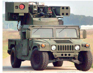
Mobiles Lasersystem «ZEUS-HLONS».

von improvisierten Sprengladungen (IED's – Improvised Explosive Devices) entwickelt. Bei dem jetzt bei den amerikanischen Truppen in Afghanistan und im Irak eingeführten Laser Ordnance Neutralization System «ZEUS-HLONS» handelt es sich um ein mobiles System zur Kampfmittelbeseitigung sowie zur sicheren und raschen Zerstörung von oberirdisch verlegten IED's. Das System ist in einem Mehrzweckfahrzeug «Humvee» integriert und ver-