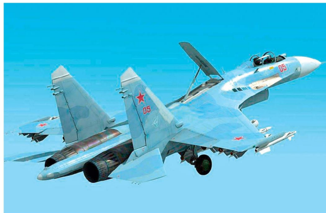
Mehrzweck-Kampfflugzeug Suchoi Su-35 «Flanker-E».

Gemäss Vertrag von Ende Januar 2010 wird Russland in den nächsten Jahren Waffen und Kampftechnik im Umfang von mehr als zwei Mrd. SFr. an die libyschen Streitkräfte liefern. Gleichzeitig wird Russland an Libyen alte Schulden in Höhe von rund fünf Mrd. SFr. erlassen. Unterdessen sind weitere Details zum neuen Waffengeschäft bekannt geworden. Der Vertrag beinhaltet einerseits die Lieferung von Infanteriewaffen, u. a. auch einer grösseren Anzahl von Sturmge- wehren «Kalaschnikow» an die libyschen Landstreitkräfte. Zudem sollen die etwa 200 vorhandenen Kampfpanzer T-72 generalüberholt und modernisiert werden. Einen Schwerpunkt bildet die Lieferung von