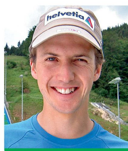
Simon Ammann, Doppel-Olympiasieger, bereitete sich mit WK's auf Vancouver vor.